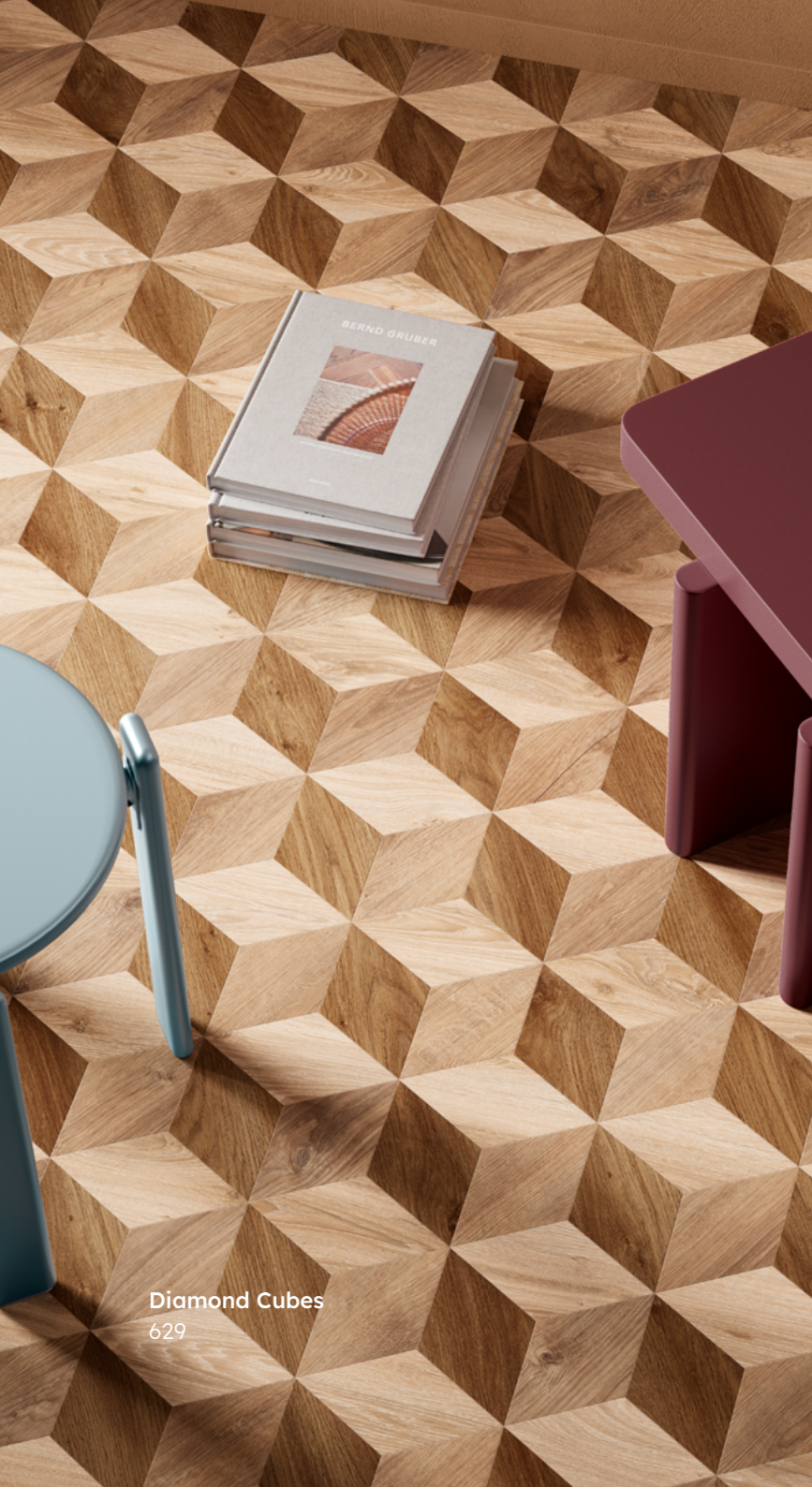
Diamond Cubes 629