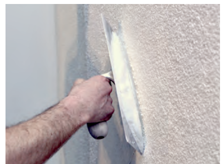
Geht perfekt von der Hand: Auftrag von Rotband Reno auf Altputz

*Der Untergrund muss trocken, tragfähig und frei von Staub oder losen Putzrückständen sein. Fliesen sind mit Knauf Spraykontakt vorzubereiten.