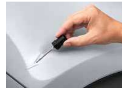
Pincel de retoque