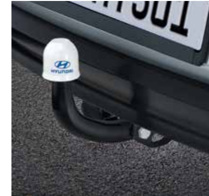
Enganche de remolque fijo