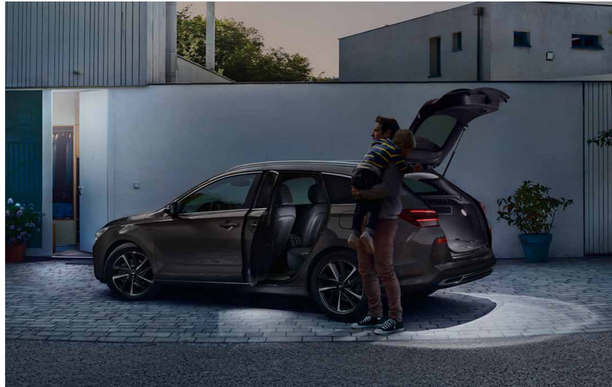
Luces led para puertas y set de iluminación para portón trasero