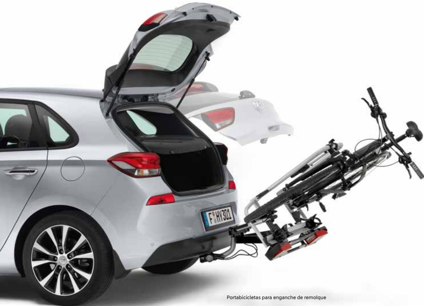
Portabicicletas para enganche de remolque

Accesorios resistentes con los que podrás llevar todo lo que necesitas en cada una de tus aventuras.