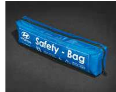
Kit de seguridad