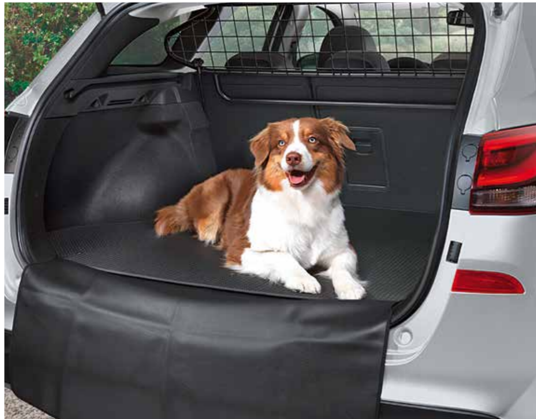
Separador de carga superior