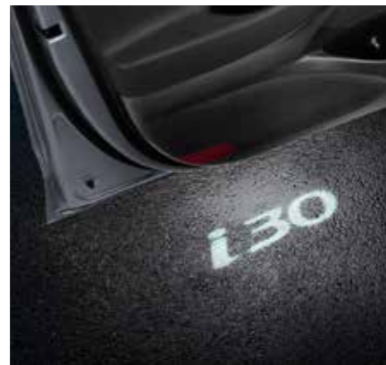
Set iluminación inferior para puerta, logotipo i30