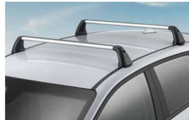
Barras portaequipajes, aluminio

99701ADE90 (conjunto adaptador U-mount para barras portaequipajes de acero)