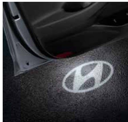
Set iluminación inferior para puerta, logotipo Hyundai