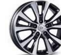
8. Llanta de aluminio de 17"