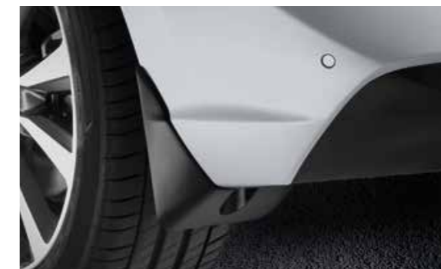
Set de guardabarros, traseros