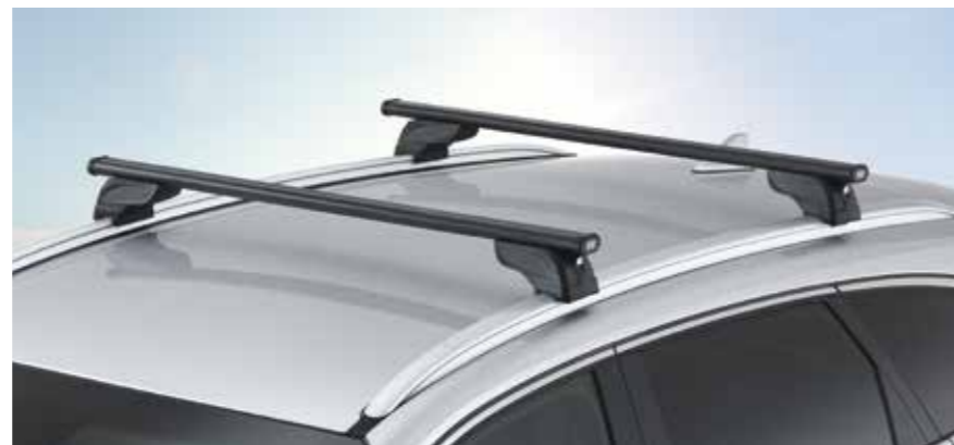
Barras portaequipajes, acero