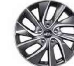
9. Llanta de aluminio de 17"