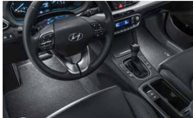
Set de iluminación interior led, blanco, primera fila

Complementa el diseño atemporal de tu nuevo i30 con los elegantes y prácticos accesorios que elijas.