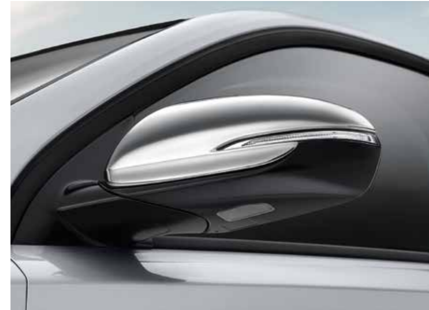
Cubiertas para los retrovisores exteriores

G4271ADE00ST (Hatchback, Wagon / juego de cuatro)