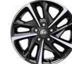
10. Llanta de aluminio de 17"