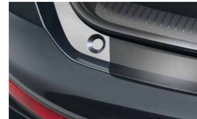
Lámina adhesiva de protección para el paragolpes trasero, negro (Fastback)