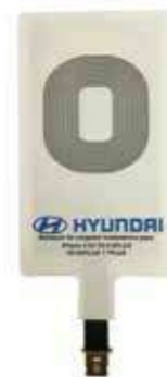
Cargador Inalámbrico Qi Fácil de utilizar ya que solo es necesario conectarlo al conector de carga y alojarlo en la parte trasera de la funda del Smartphone. DP598ADC0099 (Conector Lightning iPhone 5, 5c, 5s, 6, 6s, 6 plus, 7 y 7 plus). DP598ADC0089 (Conector mini USB. No aplicable a Smartphone con conector de carga en el lateral).