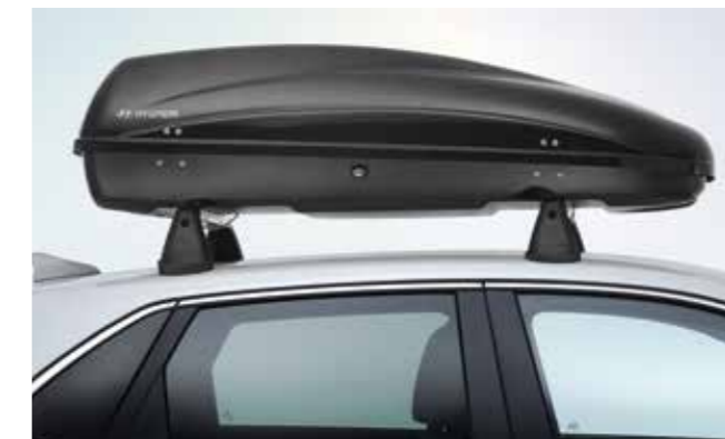
Baúl portaequipajes 330