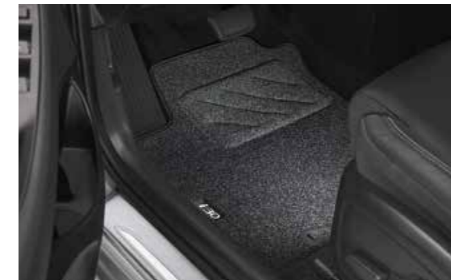
Alfombrillas textiles, estándar