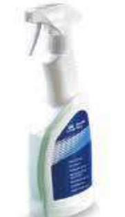
Limpiador de llantas en spray (500 ml). DP990ADC2013