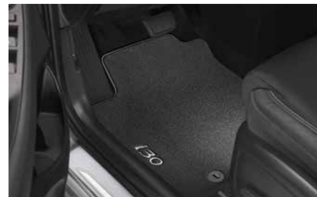
Alfombrillas textiles, velour