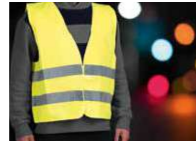
Chaleco de seguridad