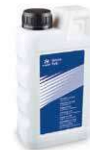
Anticongelante (LLC-A110) 1 L Este anticongelante tiene especificaciones de refrigerante de larga duración (LLC-A110). 99927ADE02

Kit de cuidado del coche para el verano Este kit contiene una botella de limpiaparabrisas concentrado para el verano gracias al cual disfrutarás de una vista de la carretera limpia y sin manchas. El aerosol eliminador de insectos retira los restos difíciles del parabrisas y de faros. Formulado especialmente para las llantas de aleación, el aerosol limpiador de llantas facilita la retirada de polvo y suciedad acumulados al frenar. La esponja es una ayuda extra para retirar las manchas resistentes en las superficies de cristal. DP990ADC2014