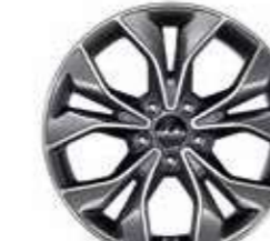
11. Llanta de aluminio de 18"