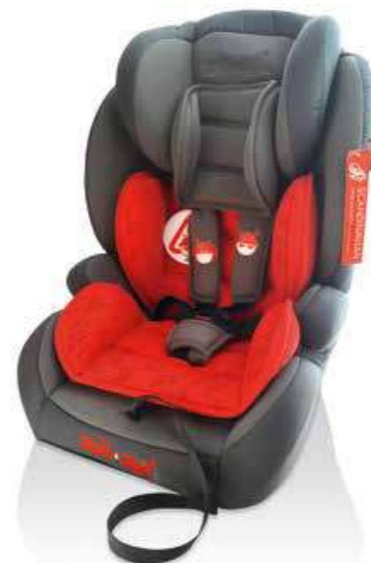
Asiento Niño Scandinavian Iso-Fix Grupos 1,2 y 3 (9-36 kg). La silla de niño Scandinavian es un sistema de retención infantil homologado para los grupos I, II, III con acoplamiento Isofix universal, diseñado para transportar bebés y niños de 9 hasta 36 kgs de la manera más segura. Uno de los aspectos más importantes de esta nueva silla es que cuenta con el sistema de arnés Top Tether. DP760ADC0098