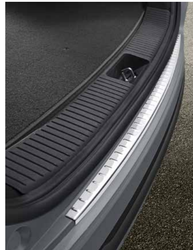
Moldura protectora para el paragolpes trasero

Adhesivos para proteger las manillas Estos adhesivos transparentes son muy resistentes. Protegen la pintura de las manillas de las puertas de cualquier tipo de arañazo. 99272ADE00 (juego de cuatro)