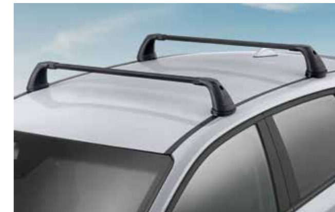
Barras portaequipajes, acero