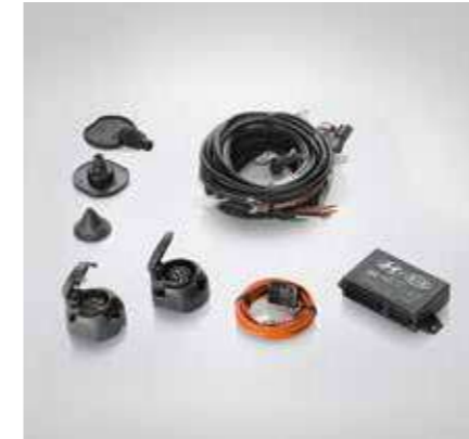
Kit eléctrico para enganche de remolque

Consulta en tu Concesionario si necesitas más información.