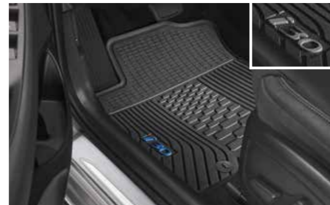
Alfombrillas de goma, con un toque de color

Mantener tu nuevo i30 limpio y ordenado también ayudará a preservar su valor y su imagen.