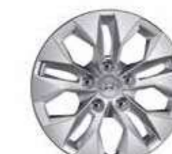
12. Tapacubos de 15"