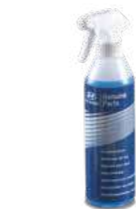
Descongelante para parabrisas en spray (500ml). DP990ADC2015