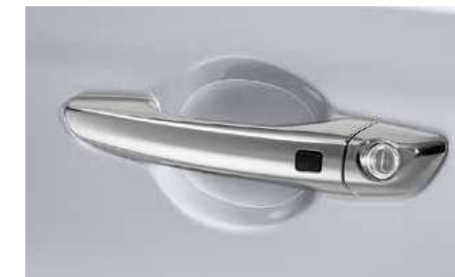
Adhesivos para proteger las manillas