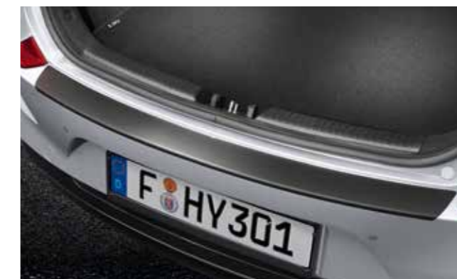
Lámina adhesiva de protección para el paragolpes trasero, negro (Hatchback)