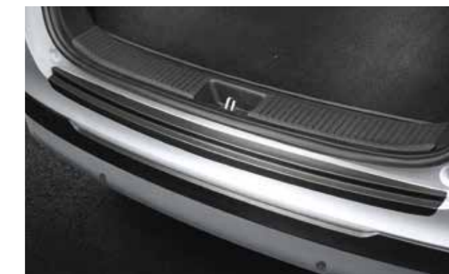
Lámina adhesiva de protección para el paragolpes trasero, negro (Wagon)