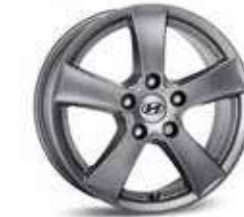
3. Llanta de aluminio de 15" Mabuk 4. Llanta de aluminio de 16"