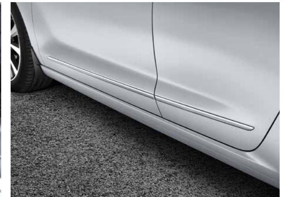
Molduras laterales para puertas