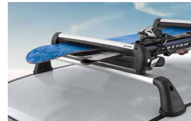
Portaesquí y tabla de snowboard 600