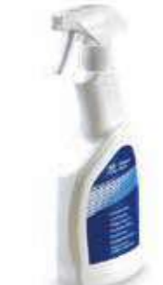
Eliminador de insectos en spray (500 ml) DP990ADC2012