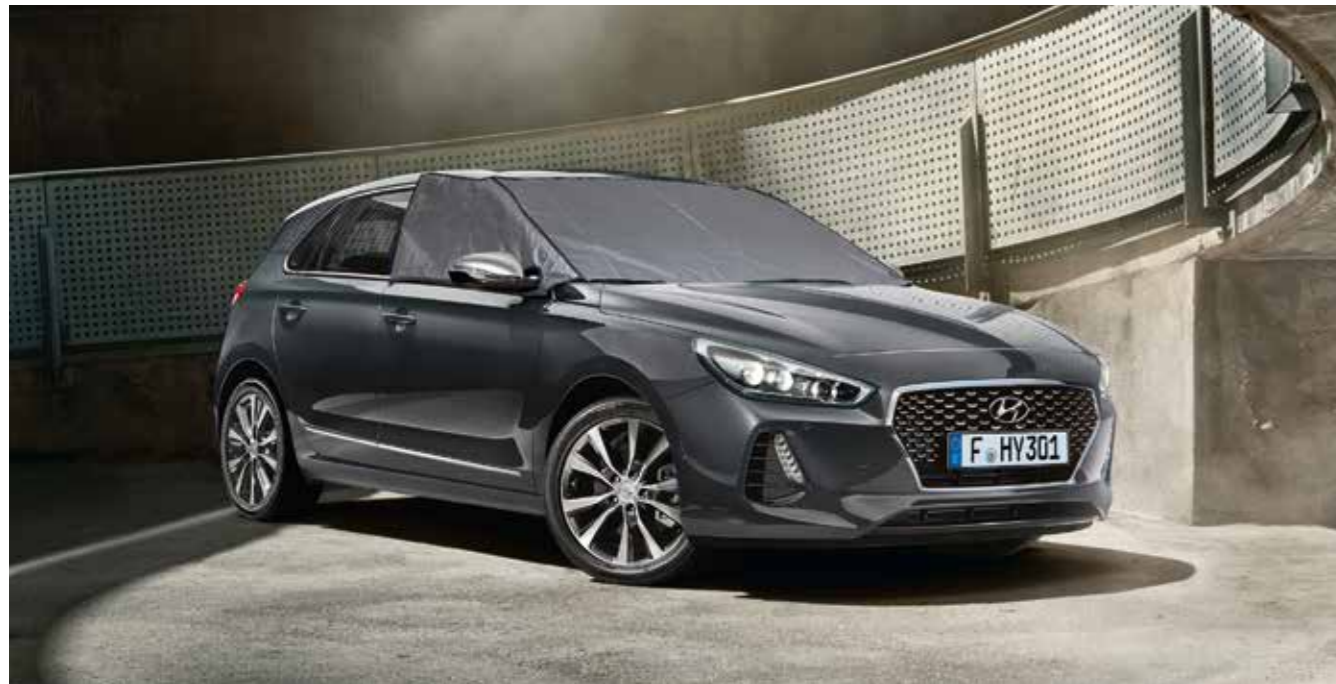
Funda protectora para el parabrisas

Soluciones prácticas e ingeniosas que hacen que cada viaje te resulte más cómodo y práctico, tanto para ti como para tus pasajeros.