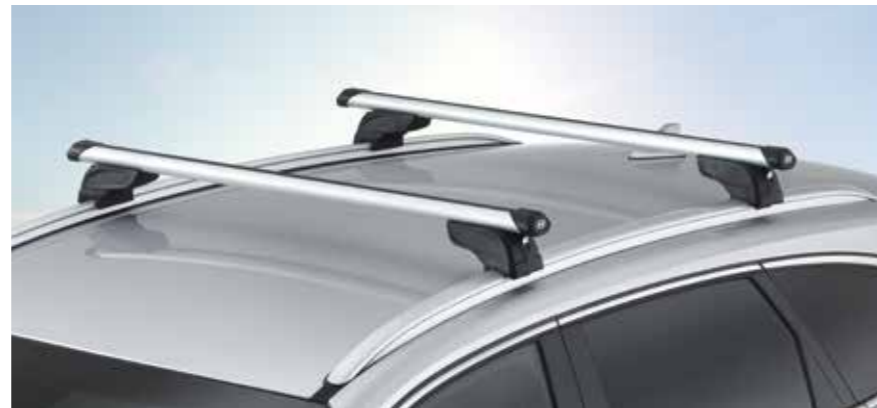
Barras portaequipajes, aluminio