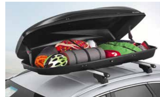
Baúl portaequipajes 390