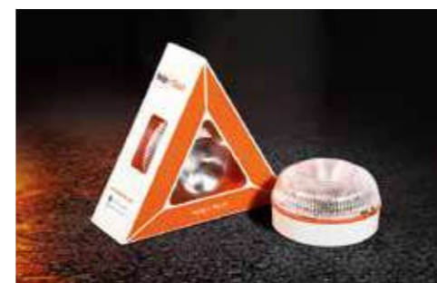
Dispositivo de Señalización Luminosa HELP FLASH Help Flash es un dispositivo homologado pensado para señalar de forma luminosa con total seguridad una parada del vehículo ya sea por avería o accidente. Ideado para evitar atropellos en carretera, se activa de manera instantánea sin necesidad de salir del coche. Las principales características de este producto radican por un lado, en su visibilidad, ya que es visible a un kilómetro de distancia en condiciones de baja luminosidad gracias a un reflector parabólico que emite un triple destello LED ámbar en todas direcciones. Y por otro, su instalación, ya que se activa de forma magnética requiriendo tan solo unos 30 segundos frente a los 8 minutos que se necesita la colocación de un triángulo de emergencia. DP999ADC0001