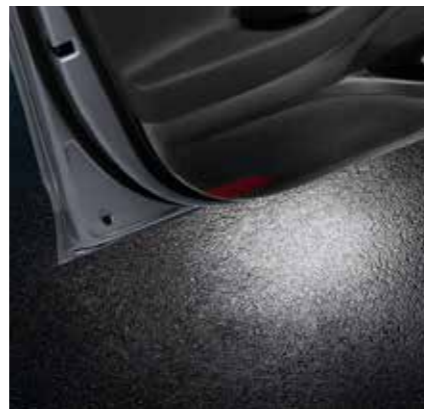
Set iluminación inferior para puerta