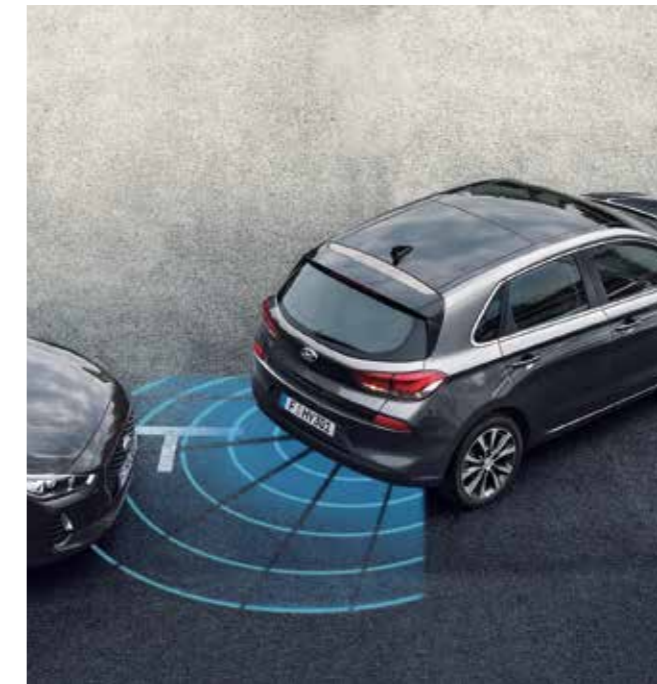
Sensores de aparcamiento trasero

Percha Evita que tus prendas se arruguen durante el viaje. Fíjala de forma fácil al asiento delantero y luego cuélgala en la oficina o en la habitación del hotel. Por motivos de seguridad, se debe retirar si el asiento trasero está ocupado. 99770ADE10