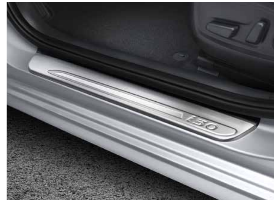
Molduras embellecedoras bajo puerta