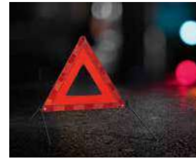
Triángulo de seguridad