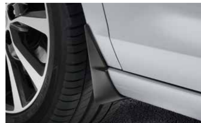
Set de guardabarros, delanteros