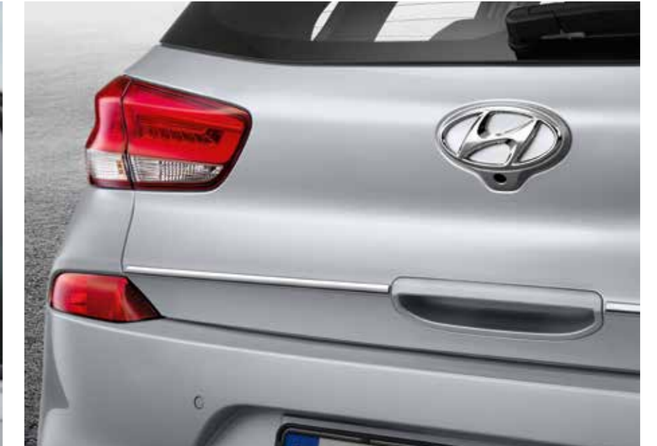
Moldura para portón trasero