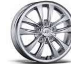
1. Llanta de aluminio de 15"

La forma más eficaz y fiable para proteger tus llantas de aleación de los ladrones. Se pueden desmontar únicamente con la llave incluida en el juego. 99490ADE50