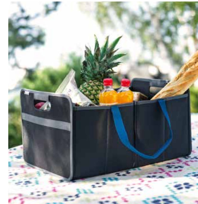
Organizador de maletero

Sensores de aparcamiento trasero Increiblemente útil cuando tienes que maniobrar en espacios reducidos. Las señales de advertencia audibles avisan al conductor cuando se acerca a algún obstáculo. 99602ADE00 (Hatchback, Wagon/delantero) 99603ADE00 (Hatchback, Wagon/trasero /se requiere un adaptador de ángulo para el i30 Wagon: 99603ADE99)