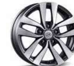
6. Llanta de aluminio de 16"