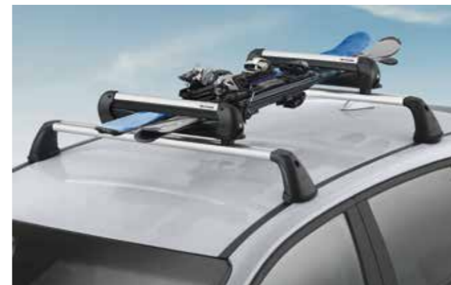
Portaesquí y tabla de snowboard 400