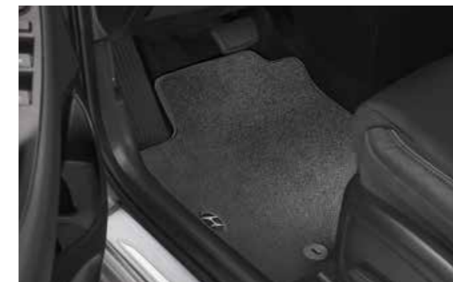
Alfombrillas textiles, premium

Alfombrillas de goma, con un toque de color Sea cual sea la aventura en la que te embarques y el tiempo que haga, con estas alfombrillas resistentes y fáciles de limpiar, podrás despreocuparte de zapatos mojados, llenos de barro o de arena cuando te subas al coche. Están hechas a medida. Incluyen el logotipo i30 en dos colores distintos y se sujetan mediante puntos de anclaje.