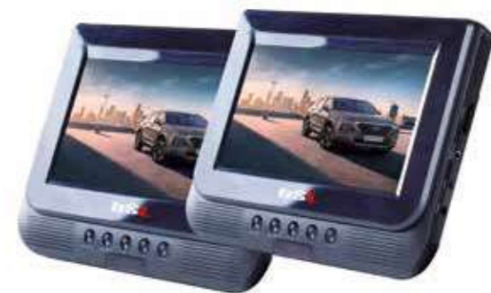
DVD Portátil de doble pantalla BSL9D Con doble pantalla de 9" y entrada USB. Múltiples formatos de lectura y mando a distancia multifunción. Incluye cintas y soportes rígidos para los cabeceros. DP580ADC0098