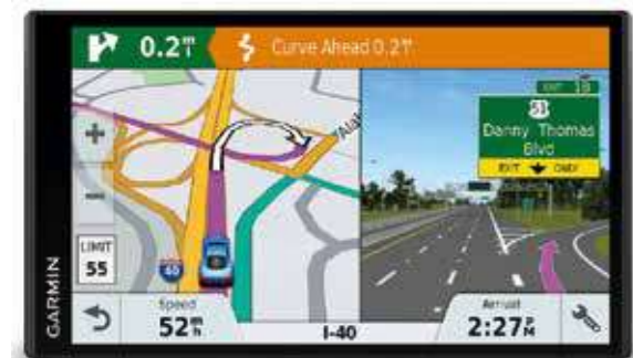
Navegador Portátil DRIVESMART 55 Pantalla 5,5", Cartografía de Europa, Mapas gratis de por vida, WiFi® y Bluetooth®, Rec. Voz, Notificaciones móvil, tráfico, Radares. DP592ADC5D5

Un mundo de posibilidades para ti y tu familia.