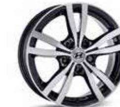
5. Llanta de aluminio de 16" Asan