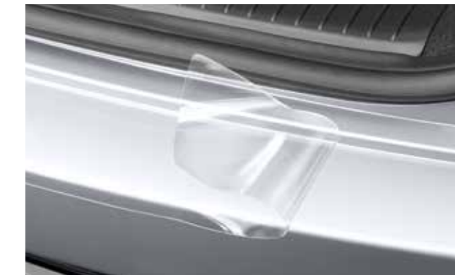
Lámina adhesiva de protección para el paragolpes trasero, transparente