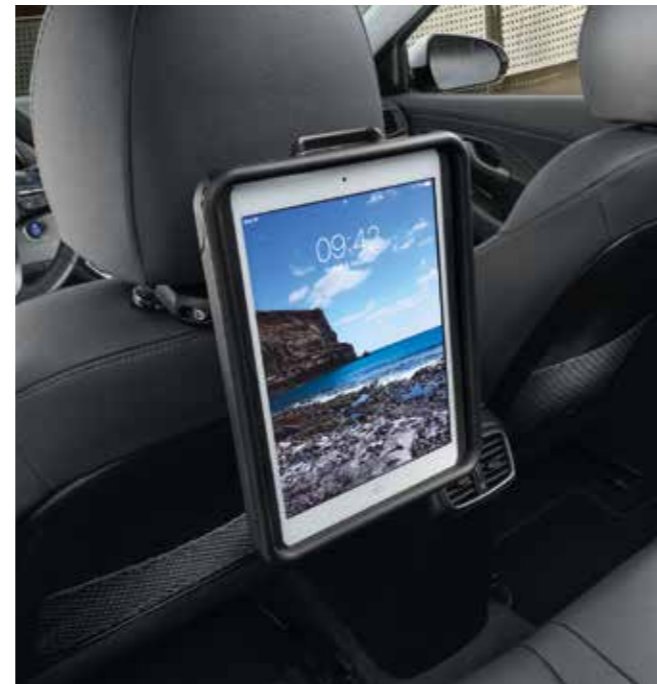
Soporte de ocio en el asiento trasero para iPad®

Funda protectora para el parabrisas Confort y visibilidad en cualquier época del año. Protege el habitáculo del calor extremo en días soleados y evita la congelación del parabrisas y ventanillas delanteras con temperaturas bajo cero. G4723ADE00 (Hatchback, Wagon)