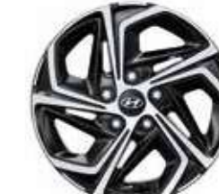
7. Llanta de aluminio de 16"