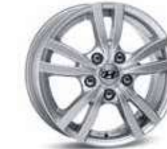
2. Llanta de aluminio de 15" Asan