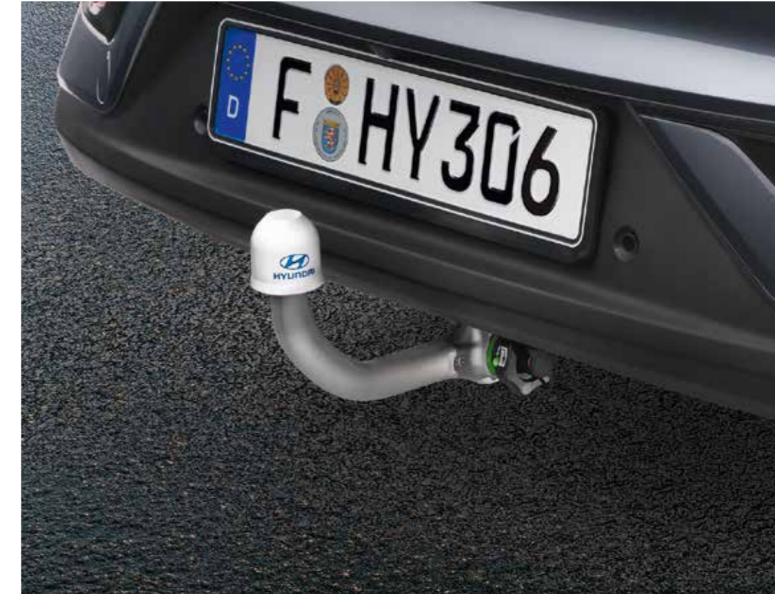
Enganche de remolque desmontable