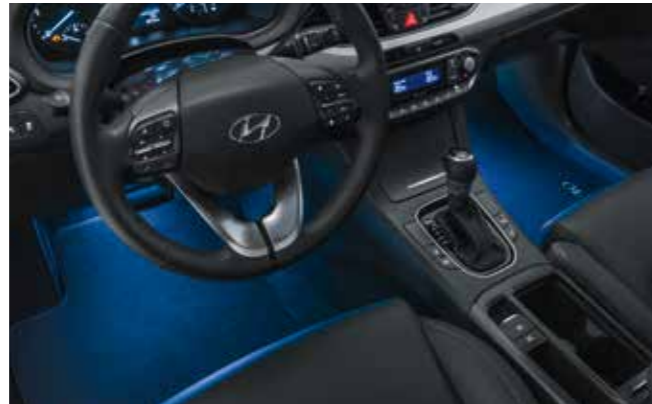
Set de iluminación interior led, azul, primera fila