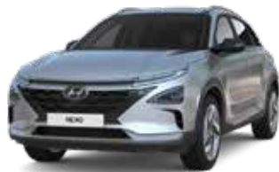
Shimmering Silver (R2T)