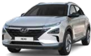
Creamy White (TW3)