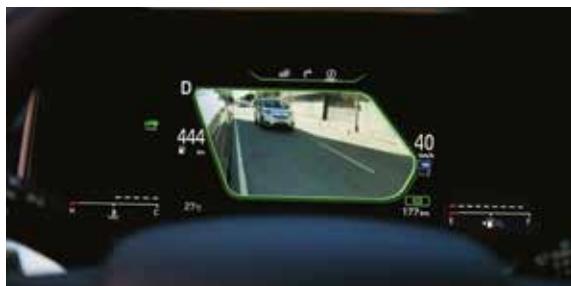
Blind-spot view monitor