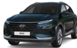
Ocean Indigo (PS8)