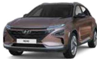
Copper Metallic (R3C)