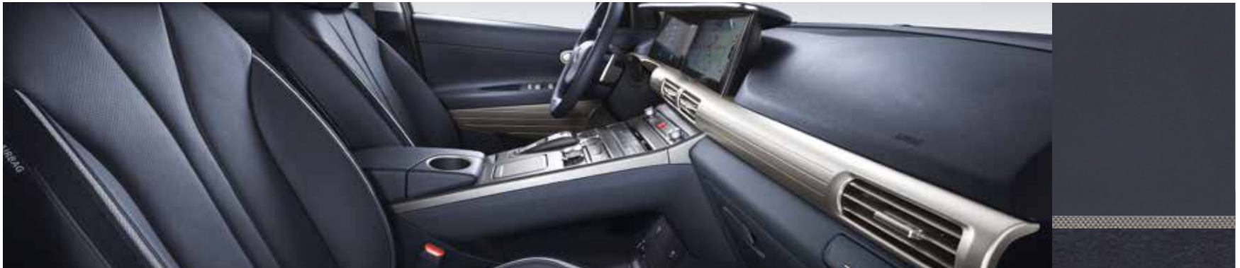
Blue one-tone interieur