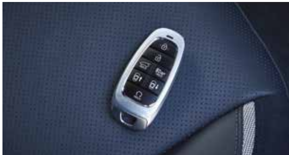
Smart key (met parkeren op afstand)