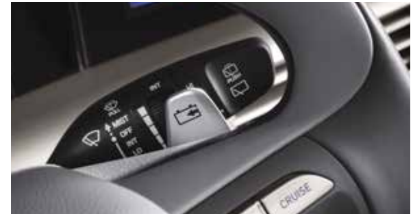
Paddle shift (regeneratief remmen)