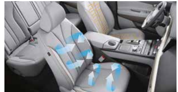
Geventileerde en verwarmde zetels vooraan