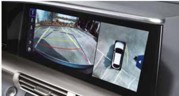
Around view monitor