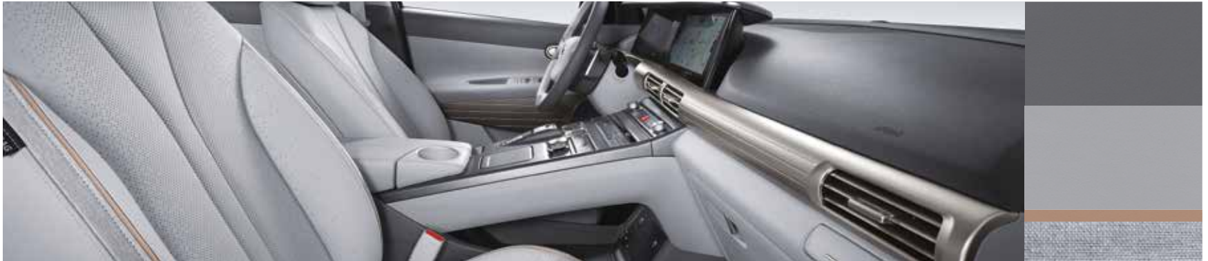
Gray two-tone interieur