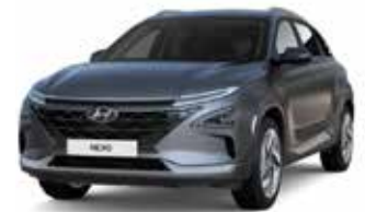
Titanium Gray (Mat) (Y3G)