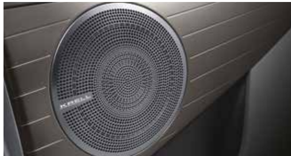
KRELL premium sound