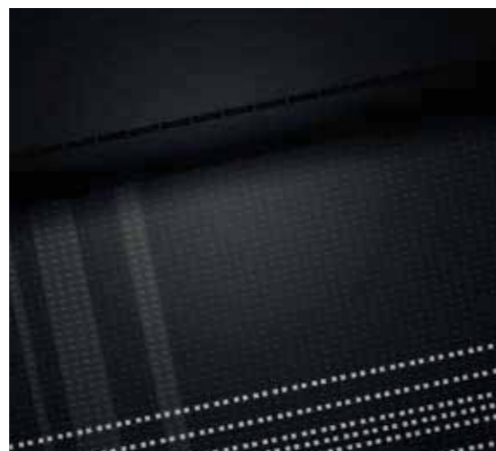
Zwarte zetels met witte strepen (Air)