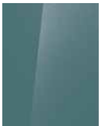
Mangrove Green (MG2/5MG*)