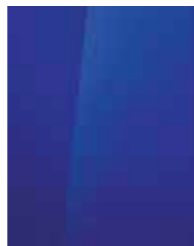
Intense Blue (YP5/5YP*)