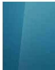
Aqua Turquoise (U3H/5U3*)