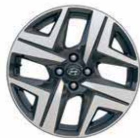
17" lichtmetalen velgen (Sky)