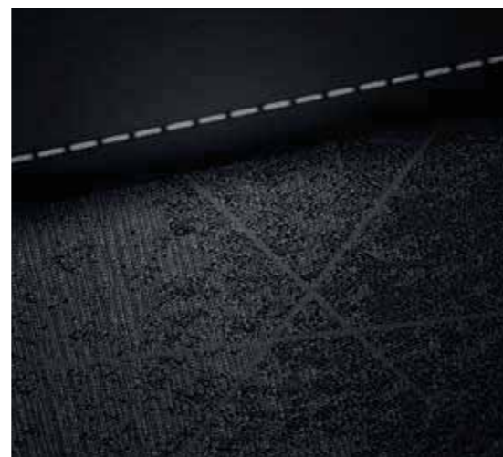
Zwarte zetels met grijze strepen (Twist, Techno & Sky)