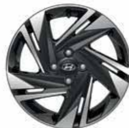
16" lichtmetalen velgen (Techno)