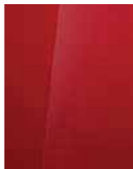
Dragon Red (WR7/5WR*)