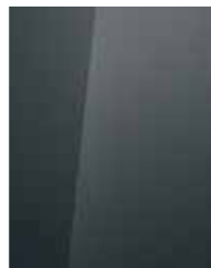
Aurora Grey (A7G)