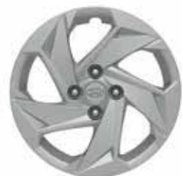
15" stalen velgen met wieldeksels (Air & Twist)