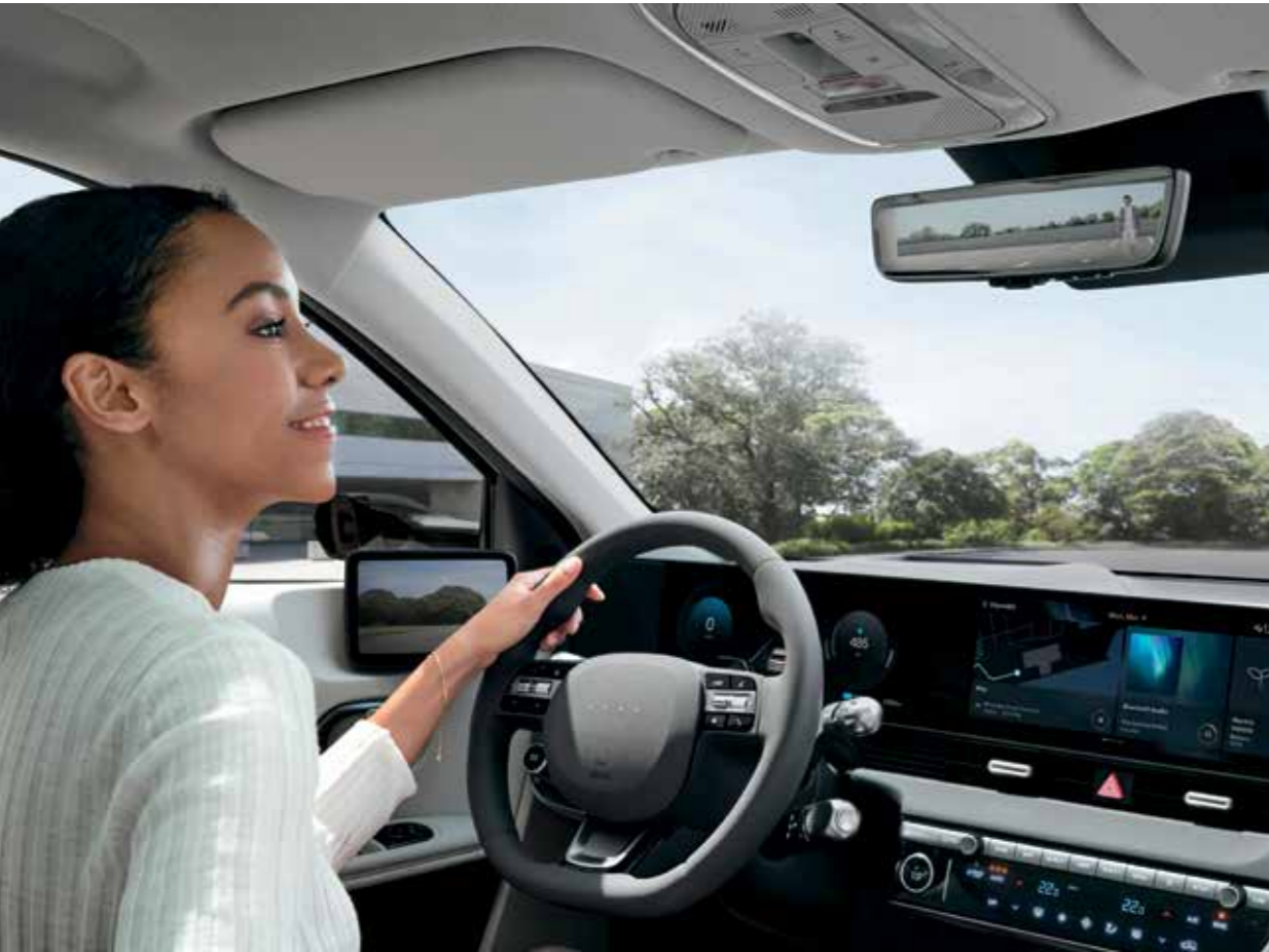
Rétroviseur numérique (Full Display)

Conçu pour concentrer votre attention sur votre voyage, avec une grande sélection de caractéristiques innovantes.