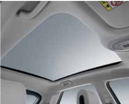
Vision roof (toit panoramique fixe en verre)