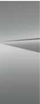
Cyber Gray (C5G)