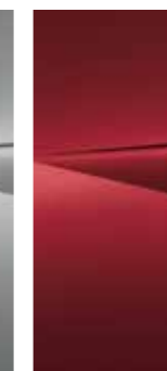
Ultimate Red (R2P)