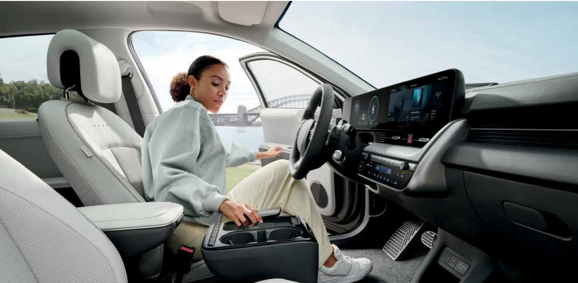
Console centrale coulissante / Système de recharge sans fil pour GSM

Aménagé de manière innovante pour élargir votre espace de vie confortable.