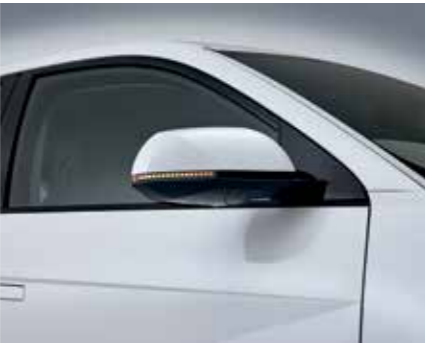
Indicateurs de direction dans les rétroviseurs extérieurs