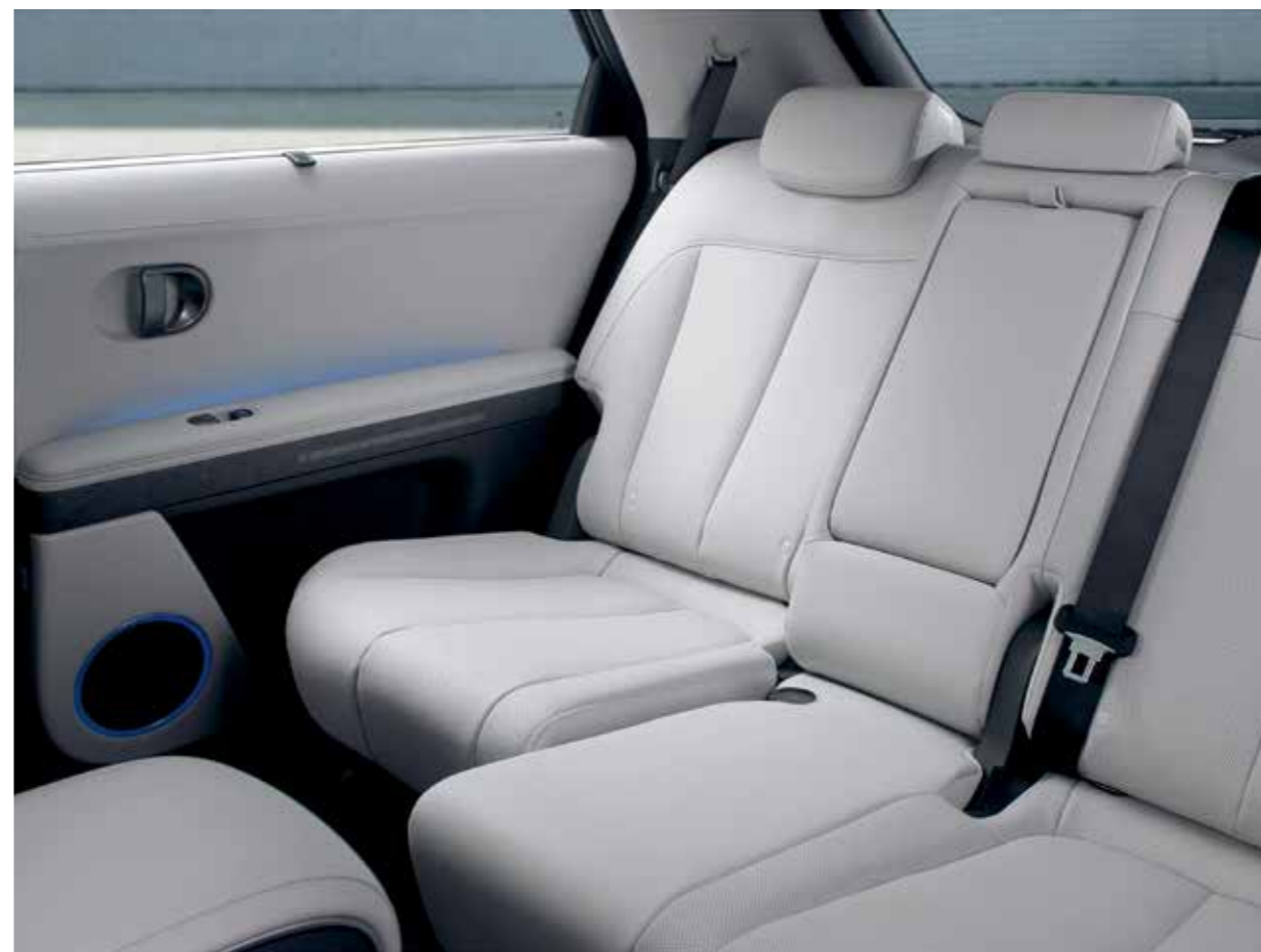
Sièges arrière coulissants électriques