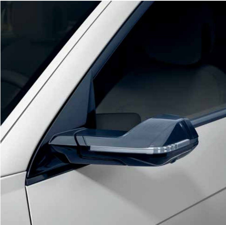
Rétroviseurs extérieurs numériques aérodynamiques (DSM)