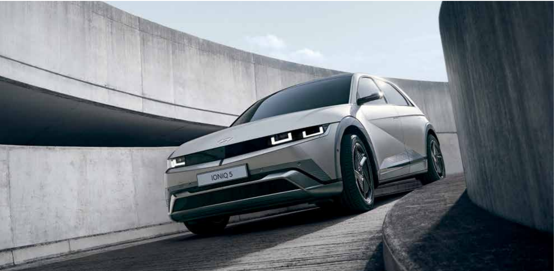
Design de pare-chocs et plaques de protection larges à l'avant / Phares LED Matrix avant (avec barre lumineuse)

Chaque centimètre carré de la nouvelle IONIQ 5 a été soigneusement affiné, y compris les détails des jantes, ce qui a permis de rehausser son design emblématique et d'améliorer l'aérodynamisme.