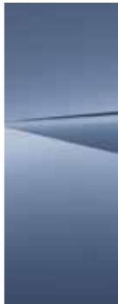
Meta Blue (PM2)