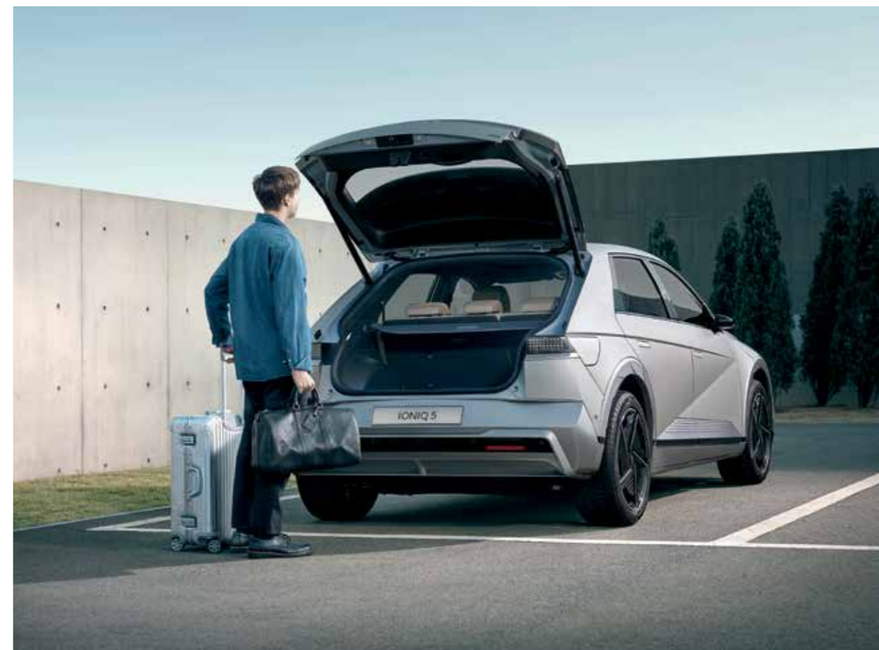
Hayon de coffre automatique