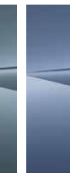
Meta Blue (PM2)