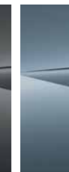
Lucid Blue (U3P)