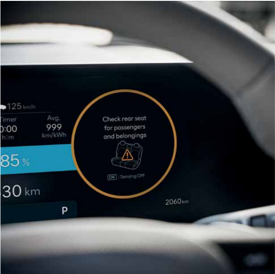
ROA (Rear Occupant Alert), détection passager arrière sans capteur