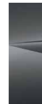
Ecotronic Gray (PE2)