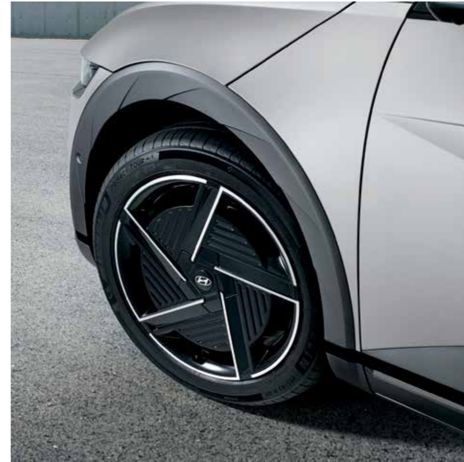
Jantes en alliage léger 20" Rétroviseurs extérieurs numériques aérodynamiques (DSM)