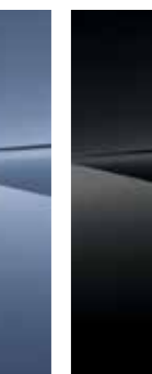
Abyss Black (A2B)