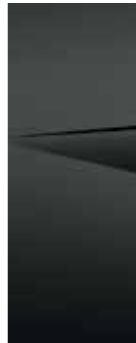
Ecotronic Gray (NET)