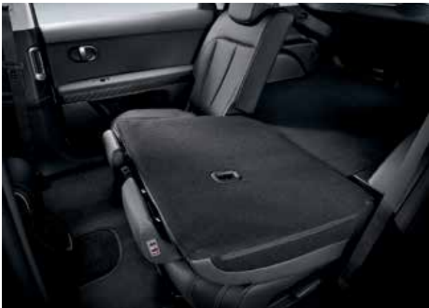
Sièges avant avec mémoire Banquette arrière rabattable à distance