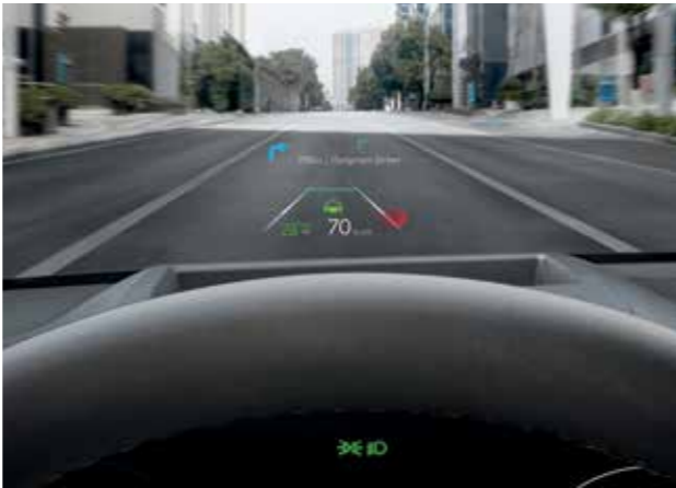
Mise à jour du logiciel OTA Affichage tête haute