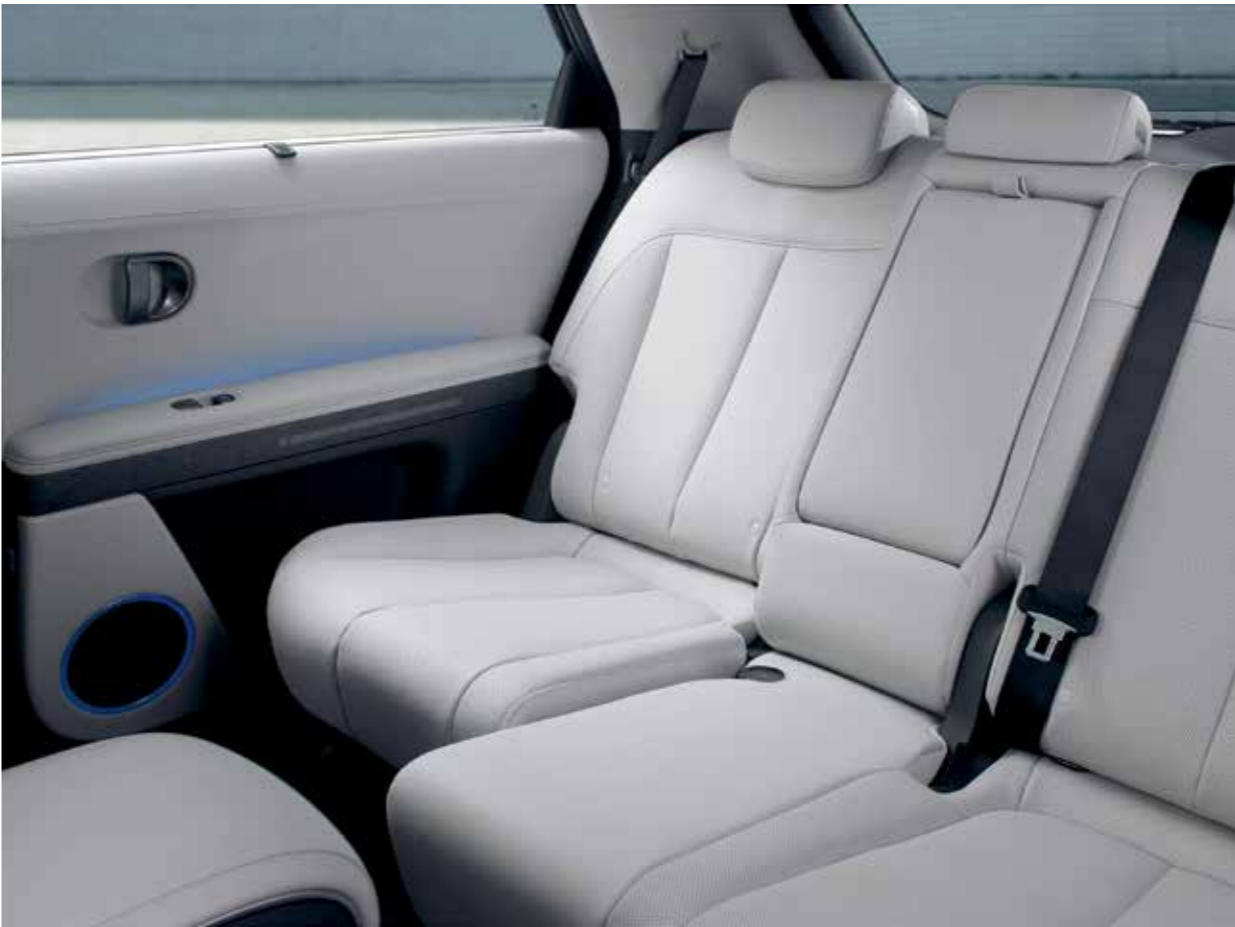
Sièges arrière coulissants électriques