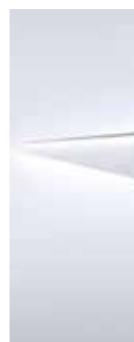
Atlas white (SAW)