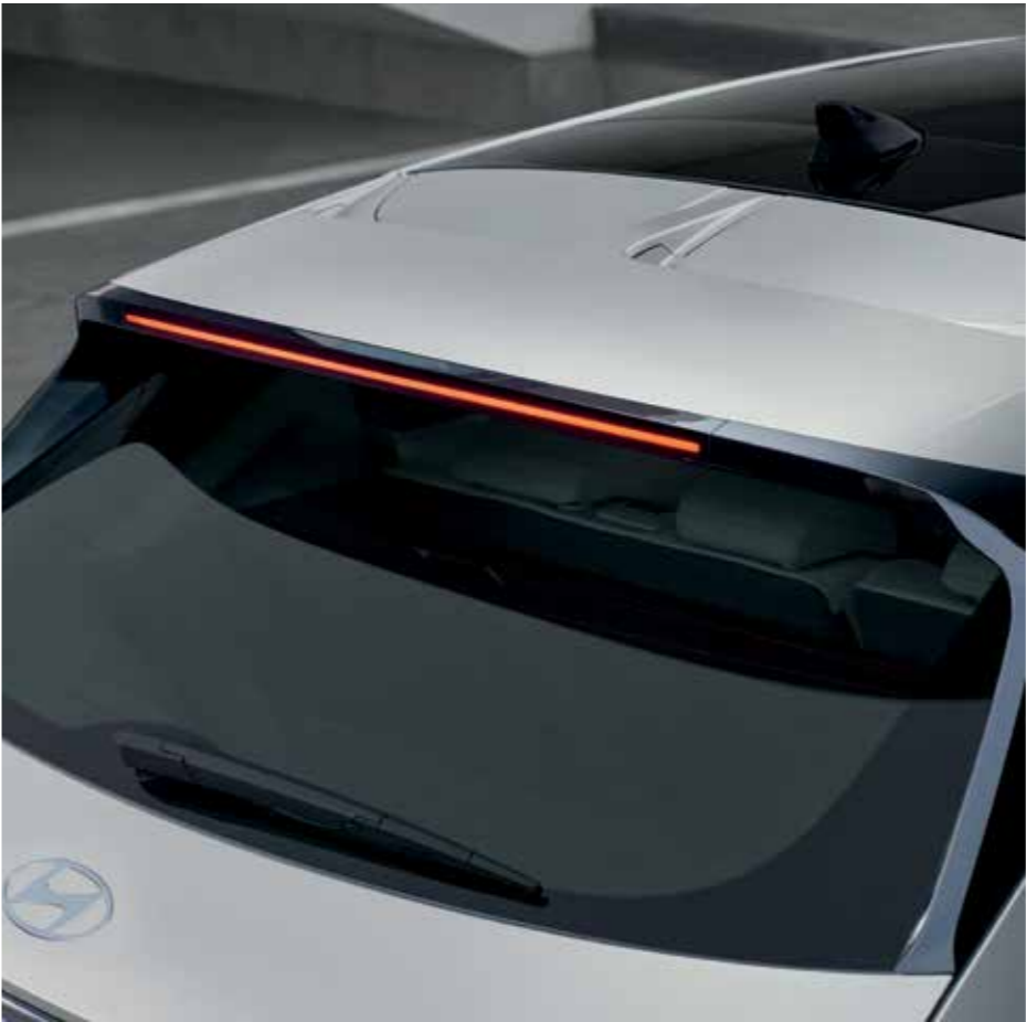
Aileron aérodynamique arrière Essuie-glace arrière