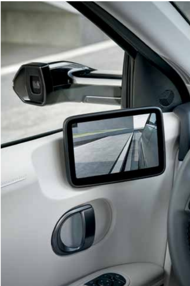
Rétroviseurs extérieurs numériques