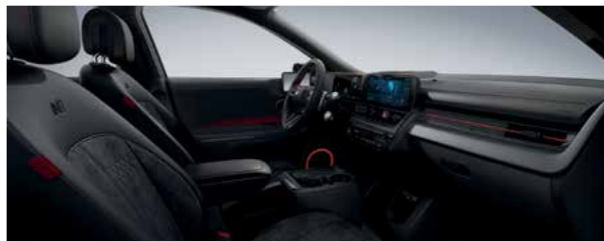
Noir N Line avec surpiqûres rouges