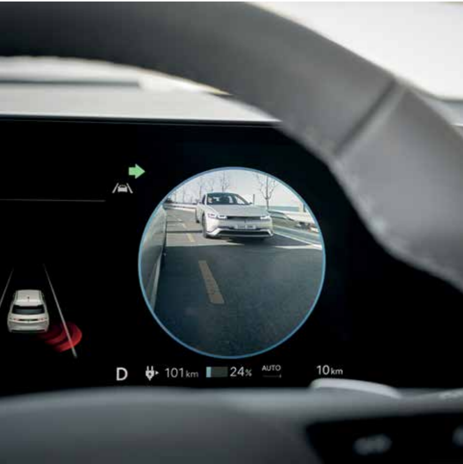
BVM (Blindspot View Monitor), caméra angle mort

Il est doté de technologies avancées qui restent en alerte pour vous permettre de voyager plus sereinement et en toute sécurité.