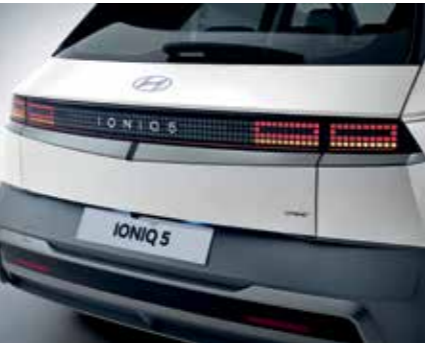
Feux arrière à LED