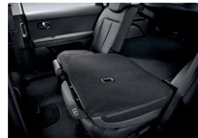
Sièges avant avec mémoire Banquette arrière rabattable à distance