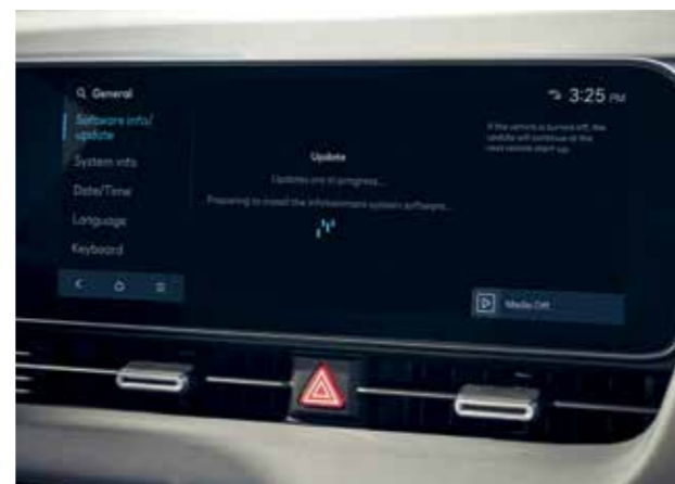
Mise à jour du logiciel OTA Affichage tête haute