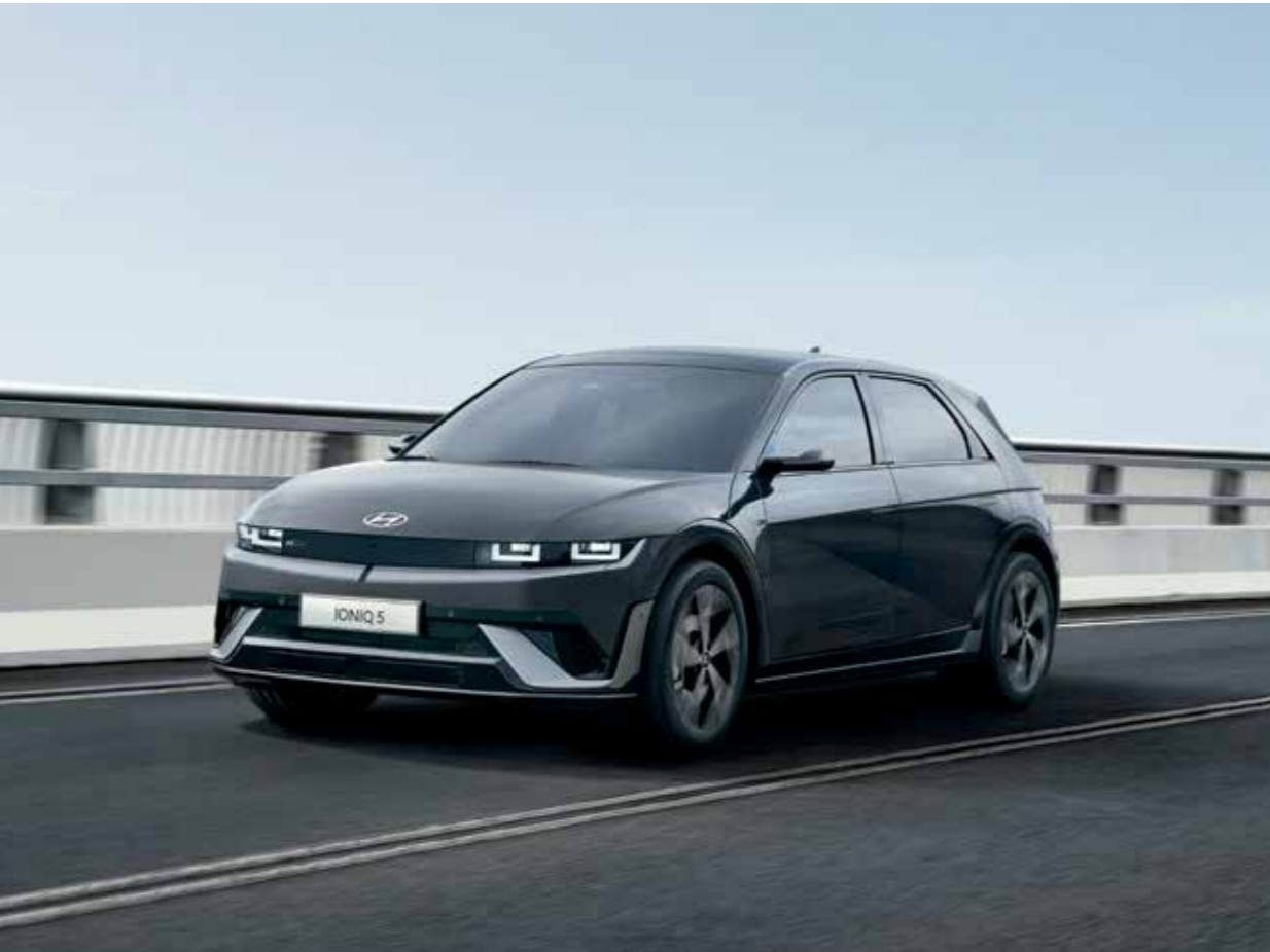
Finition aérodynamique et sportive exclusive à la N Line (avec emblème exclusif) / pare-chocs avant et plaques de protection

Conçue pour ceux qui recherchent une expérience de conduite exaltante, la nouvelle IONIQ 5 N Line affiche son dynamisme même à l'arrêt.