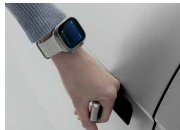
Digital Key 2.0 (ouverture & démarrage avec smartphone compatible) Point de raccordement Vehicle-to-Load intérieur (V2L)