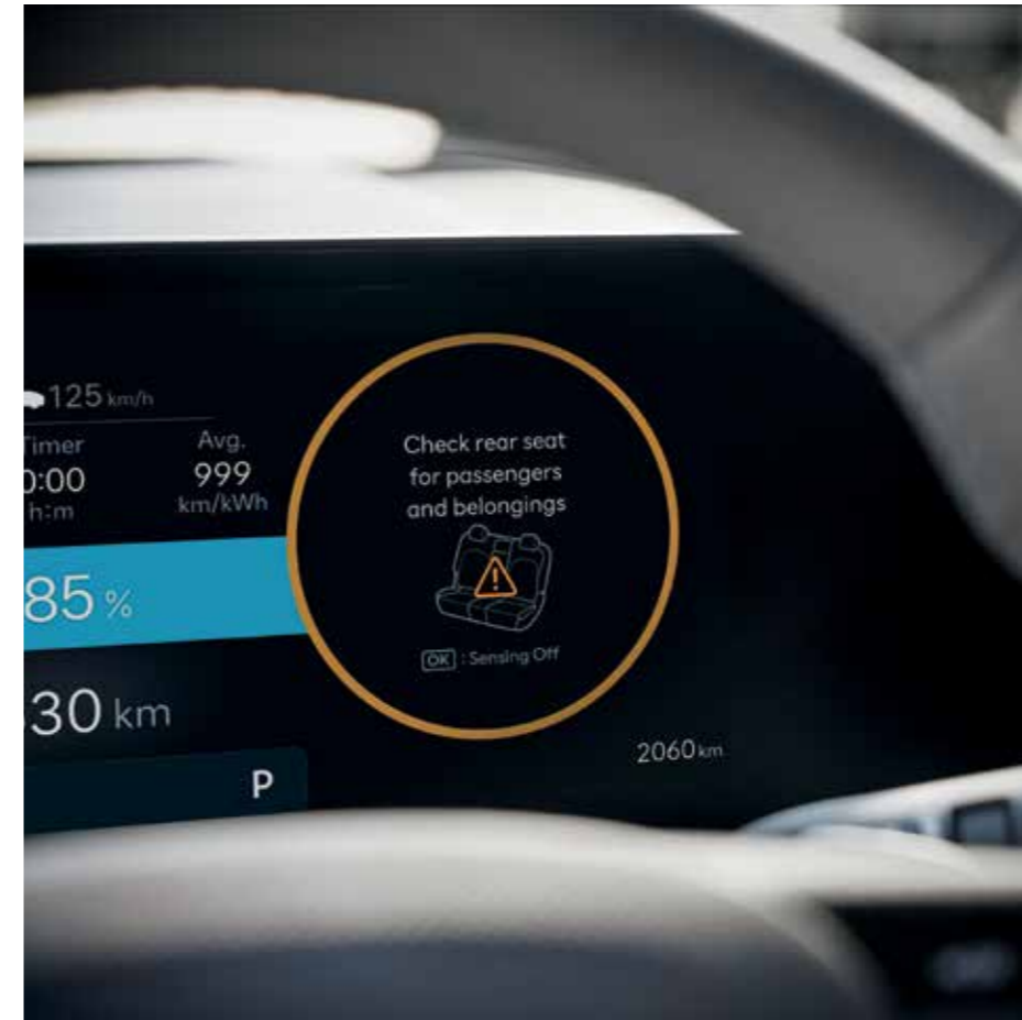
ROA (Rear Occupant Alert), détection passager arrière sans capteur