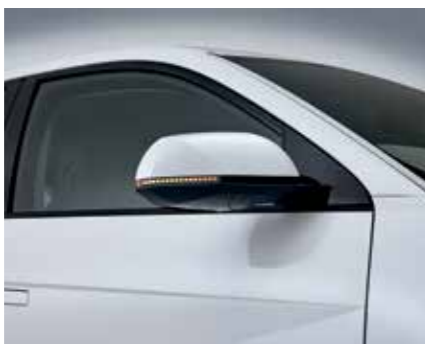
Indicateurs de direction dans les rétroviseurs extérieurs