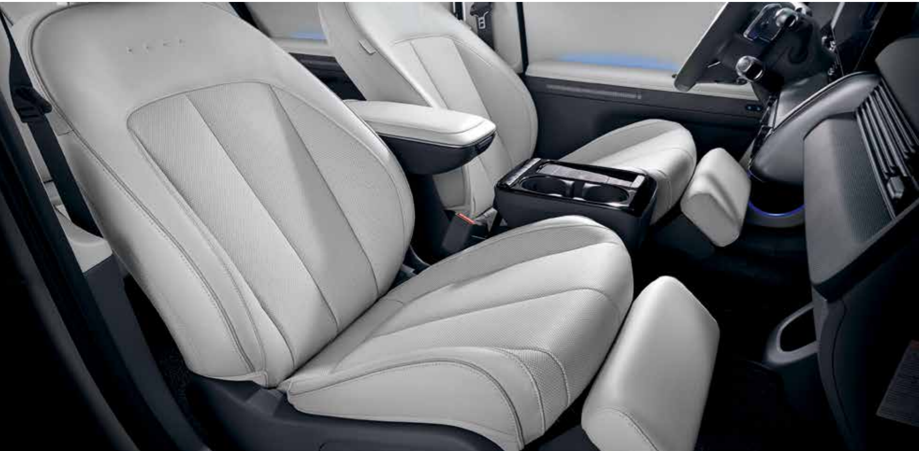
Sièges relaxants de qualité supérieure

Des technologies avancées cachées sous des matériaux de première qualité et un design simple garantissent confort et polyvalence.