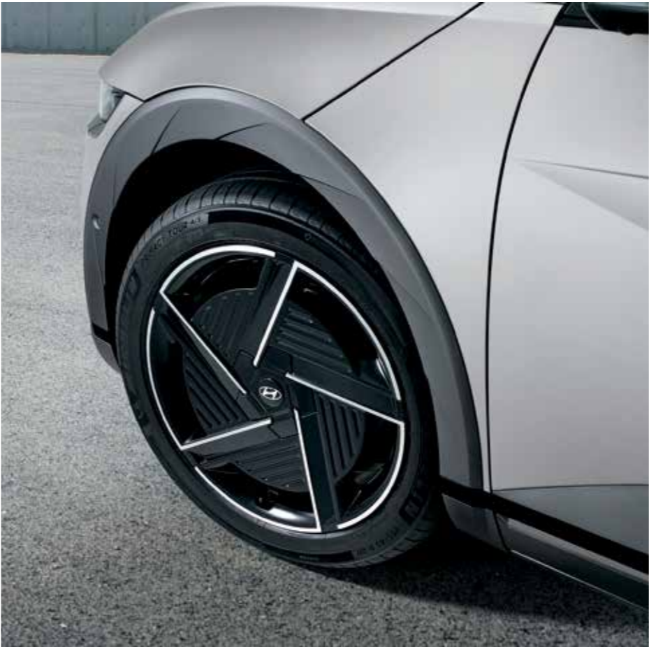
Jantes en alliage léger 20" Rétroviseurs extérieurs numériques aérodynamiques (DSM)