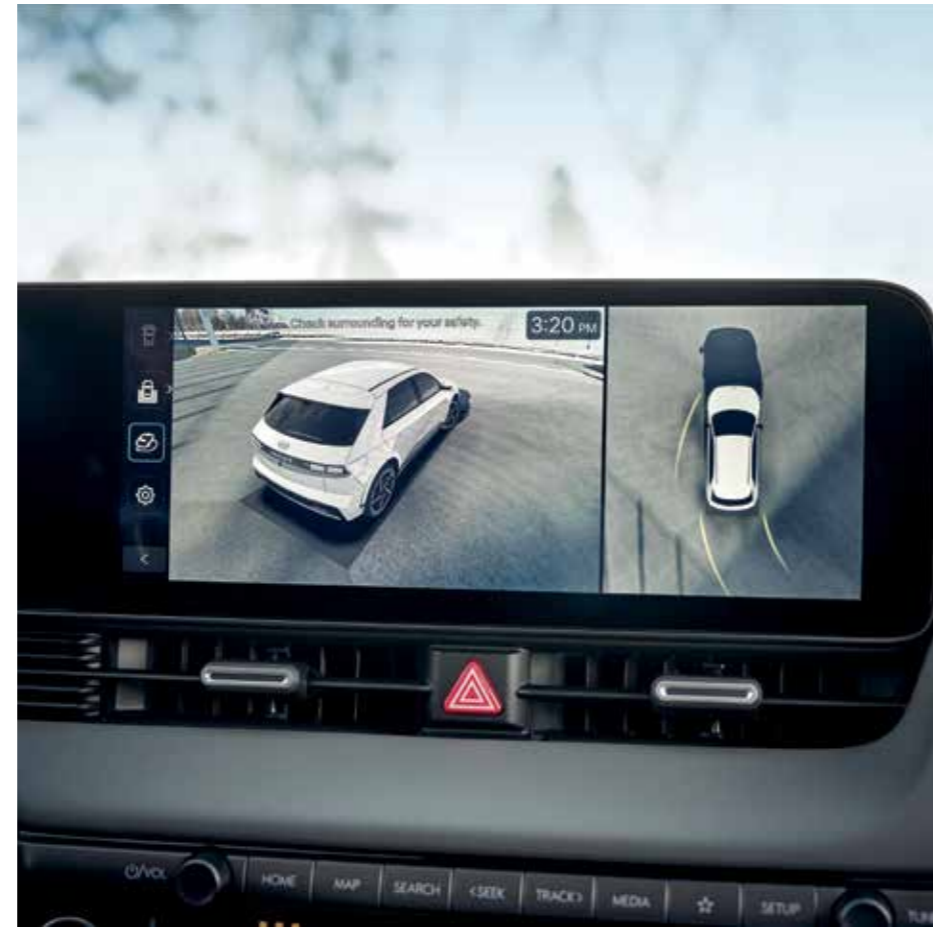
SVM (Surround View Monitor), caméra 360°