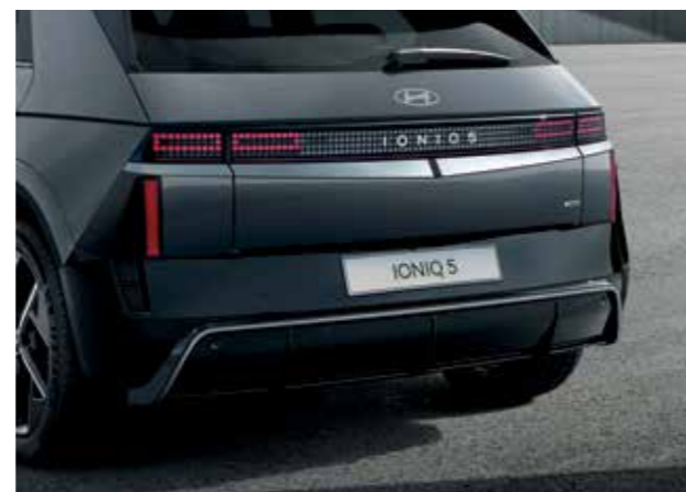
Jantes aérodynamiques de 20" à 5 branches, exclusives à la N Line Finition sportive et aérodynamique du pare-chocs arrière et plaques de protection exclusives à la N Line