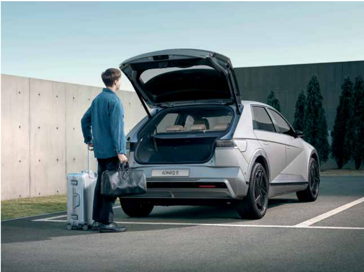
Hayon de coffre automatique