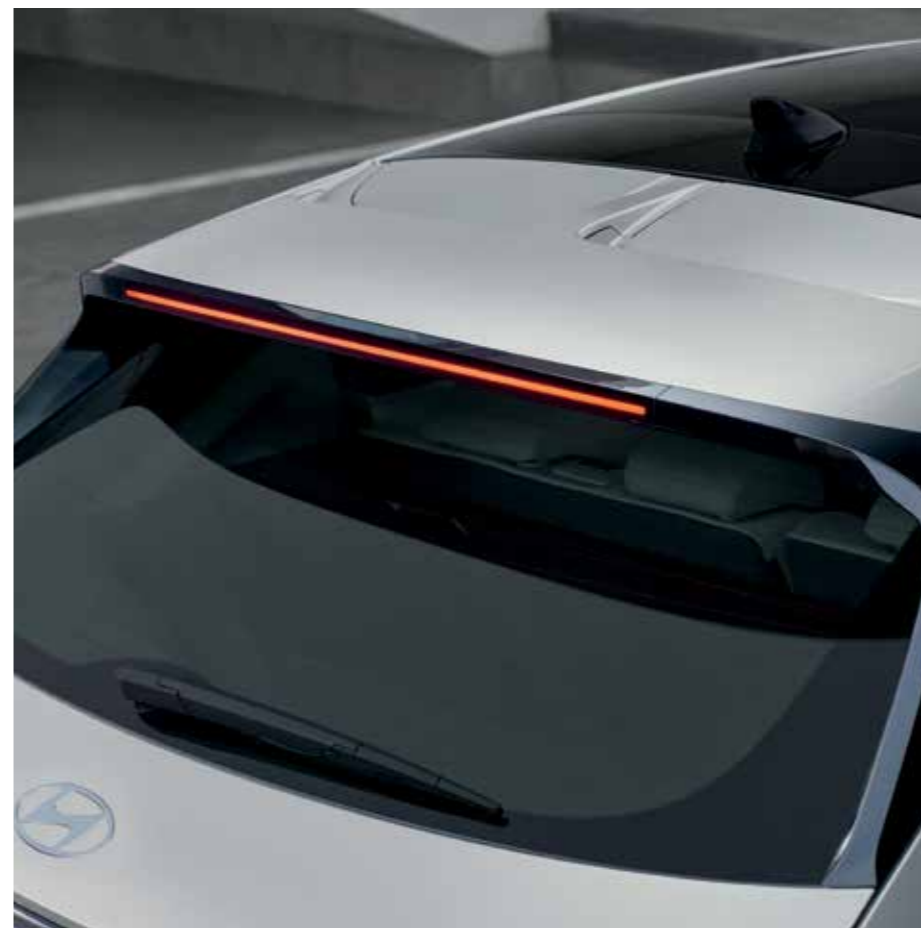
Aileron aérodynamique arrière Essuie-glace arrière