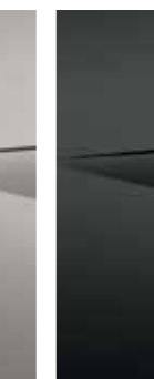
Ecotronic Gray (NET)