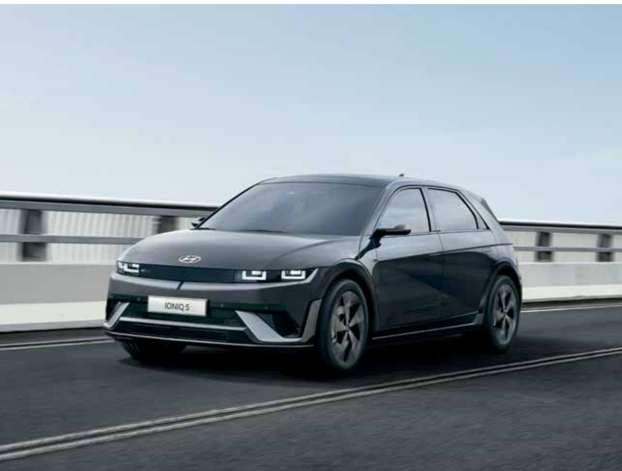
Finition aérodynamique et sportive exclusive à la N Line (avec emblème exclusif) / pare-chocs avant et plaques de protection

Conçue pour ceux qui recherchent une expérience de conduite exaltante, la nouvelle IONIQ 5 N Line affiche son dynamisme même à l'arrêt.