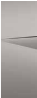
Gravity Gold (W3T)