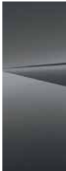
Ecotronic Gray (PE2)