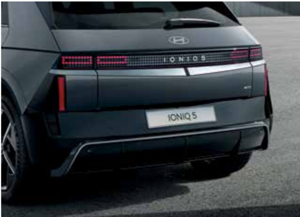
Jantes aérodynamiques de 20" à 5 branches, exclusives à la N Line Finition sportive et aérodynamique du pare-chocs arrière et plaques de protection exclusives à la N Line