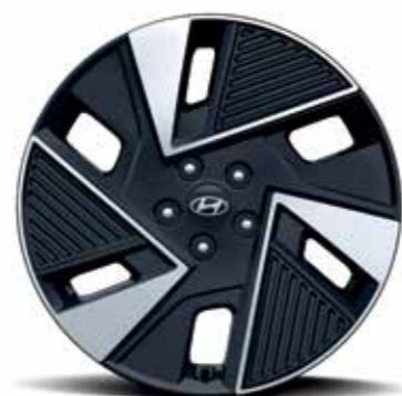
Jantes en alliage léger 19"