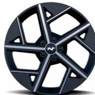
Jantes en alliage léger 20" (N Line)