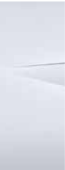
Atlas white (WAM)