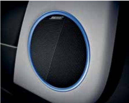
Système de sonorisation BOSE