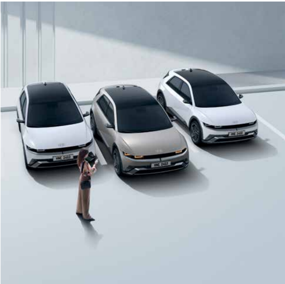
Remote Smart Parking Assist 2 (RSPA 2) Remote Smart Parking Assist 2 (RSPA 2) aide à se garer ou à quitter une place de parking. Il aide automatiquement à la direction, à l'accélération, à la décélération et au changement de vitesse à l'aide des capteurs de la voiture. Il aide automatiquement à freiner lorsqu'un objet est détecté dans la trajectoire de la voiture. Le conducteur peut effectuer des opérations à distance à l'aide de la Smart Key lorsqu'il est à l'extérieur de la voiture.