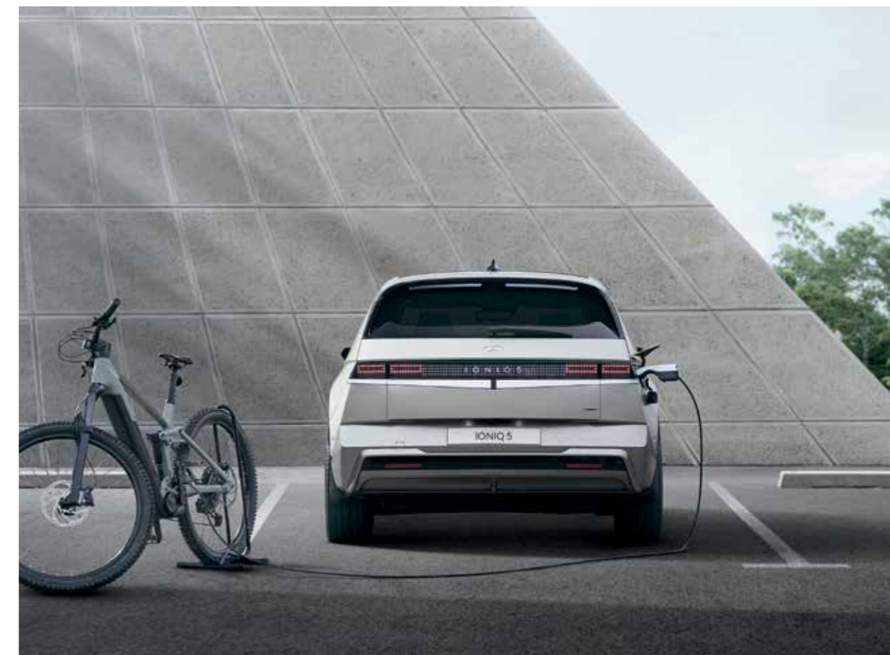
Point de raccordement Vehicle-to-Load extérieur (V2L)