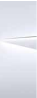
Atlas white (SAW)