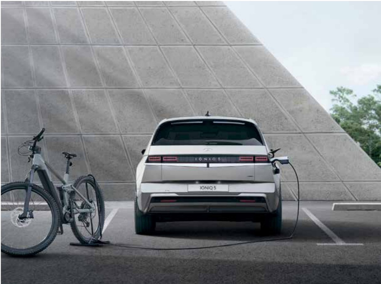
Point de raccordement Vehicle-to-Load extérieur (V2L)