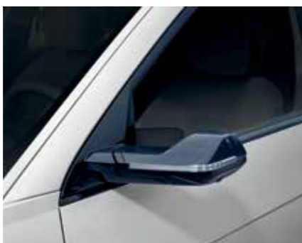
Rétroviseur numérique aérodynamique