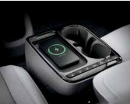
Système de recharge sans fil pour GSM