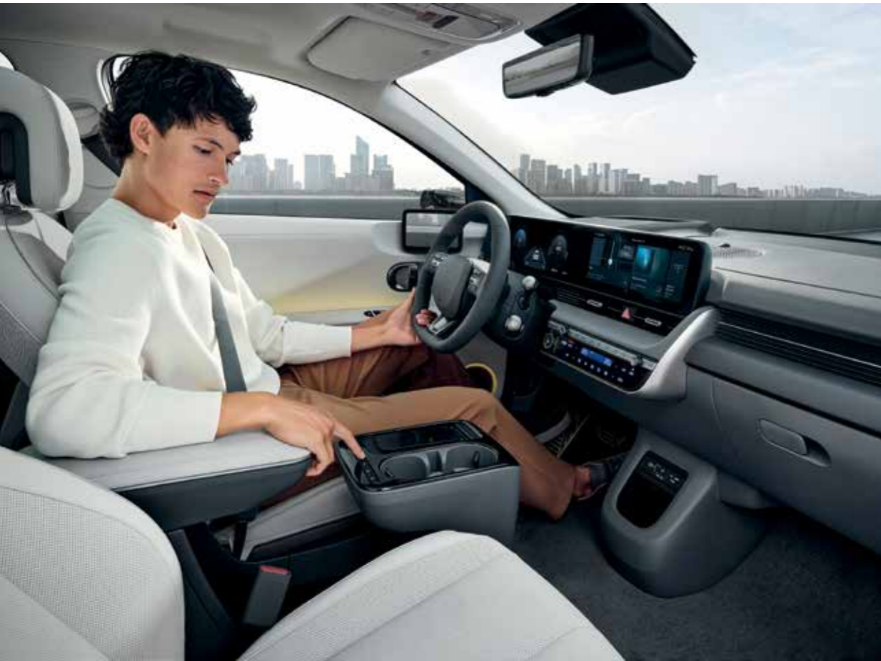
Sièges avant chauffants et ventilés

La nouvelle IONIQ 5 vous accompagne dans votre vie quotidienne en associant des fonctions numériques à des fonctions pratiques pour un confort intuitif.