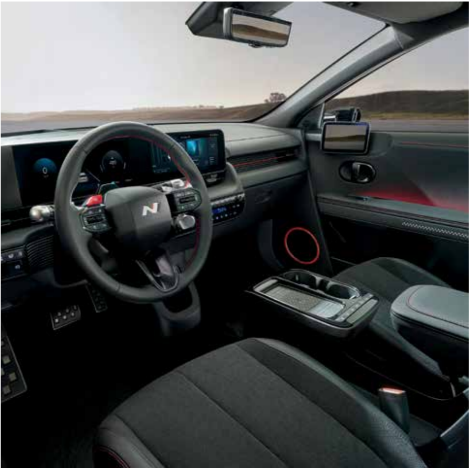
Guidon exclusif N Line / Pédales en métal