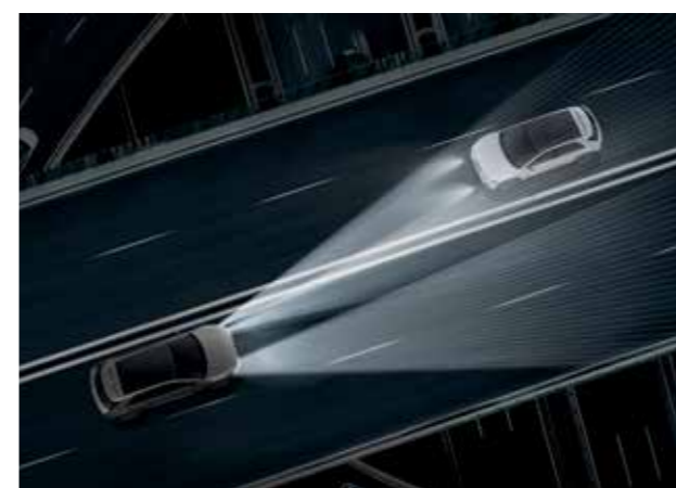
Phares LED Matrix intelligents (IFS Intelligent Front-Lighting System)