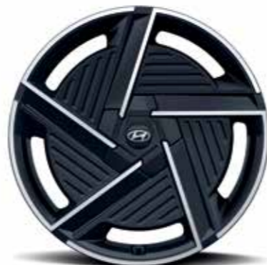
Jantes en alliage léger 20"