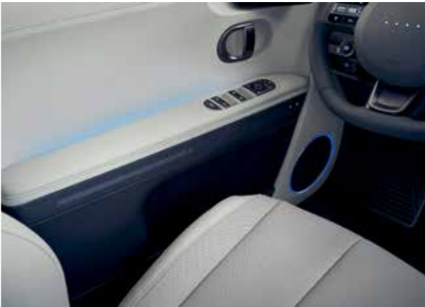
Éclairage interactif des pixels (□Démarriage / ■Inversion / ■Chargement) Éclairage d'ambiance (64 couleurs)