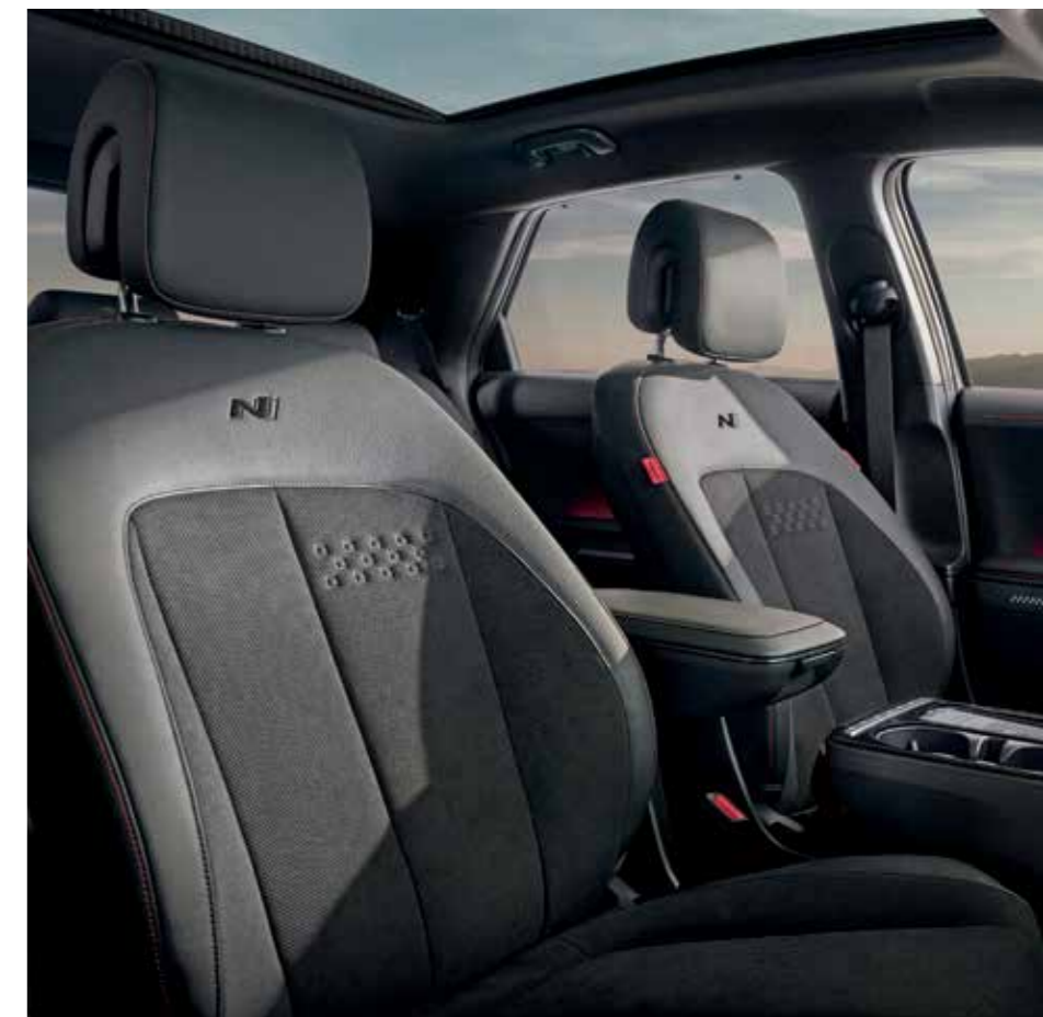
N Line siège sport exclusifs avec logo N Line / intérieur avec surpiqûres rouges