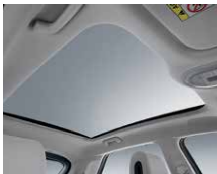
Vision roof (toit panoramique fixe en verre)