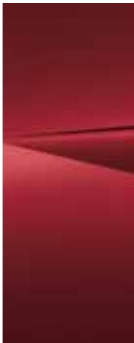
Ultimate Red (R2P)