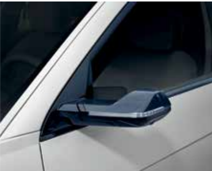
Rétroviseur numérique aérodynamique