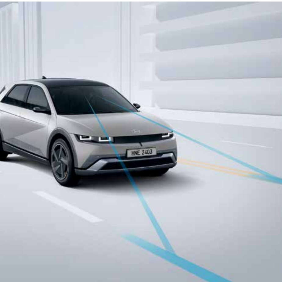
Lane Keeping Assist (LKA) Lorsque le conducteur roule à une certaine vitesse et qu'il quitte une voie sans que le clignotant soit allumé, un avertissement est émis. Lorsqu'une déviation de voie est détectée, le système assiste automatiquement la direction pour empêcher la sortie de voie.