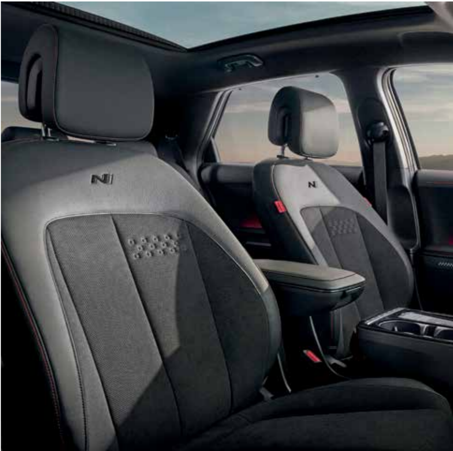
N Line siège sport exclusifs avec logo N Line / intérieur avec surpiqûres rouges