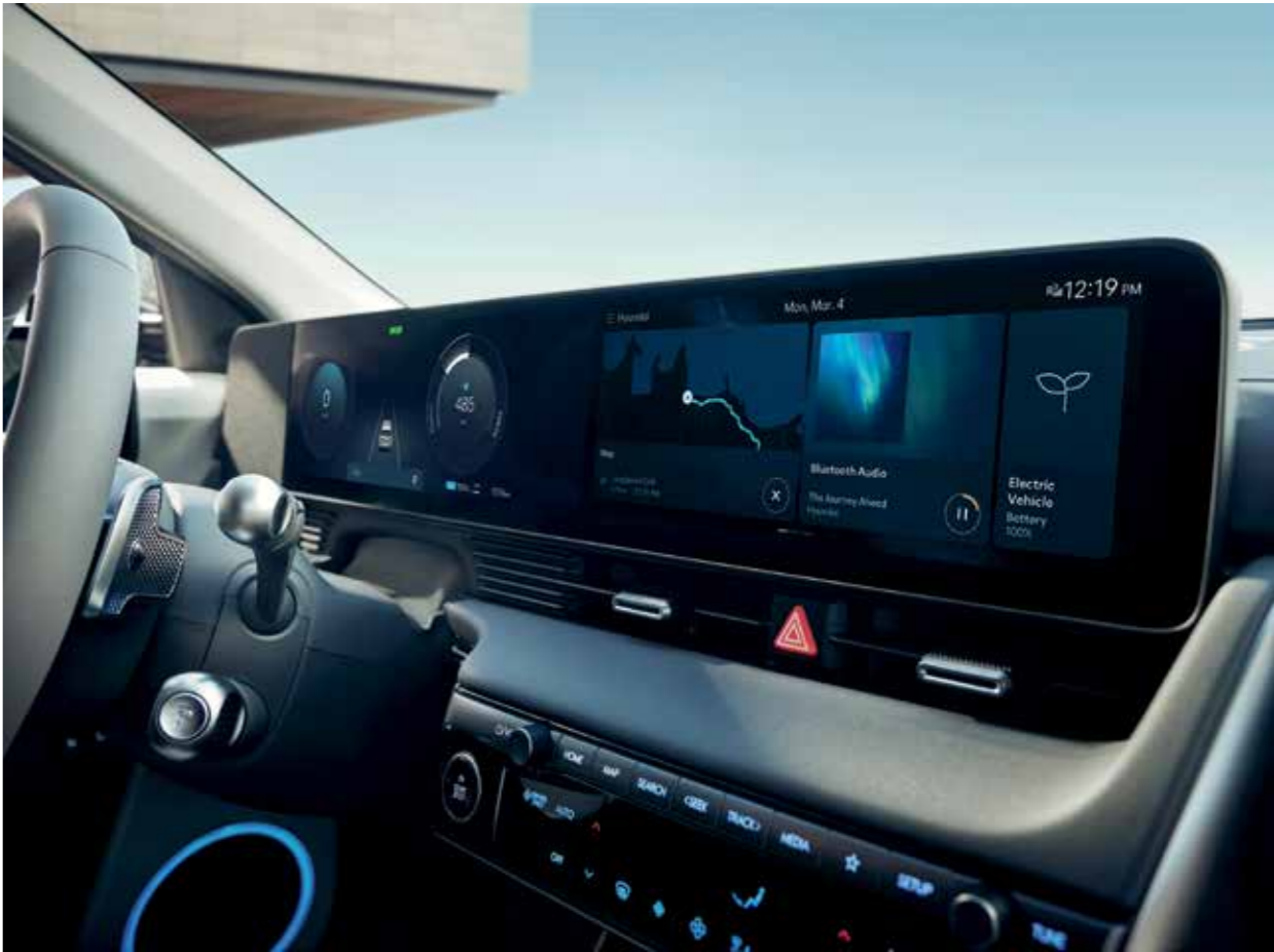
cockpit numérique 12,3" (combiné LCD) / ccNC (connected car Navigation Cockpit)