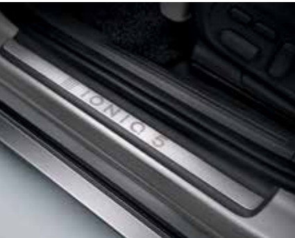
Seuil de porte métalliques