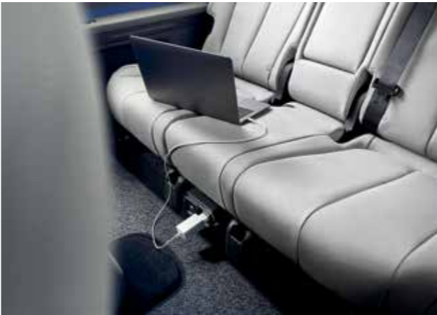
Digital Key 2.0 (ouverture & démarrage avec smartphone compatible) Point de raccordement Vehicle-to-Load intérieur (V2L)