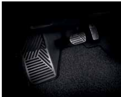
Pédales et repose-pied en métal