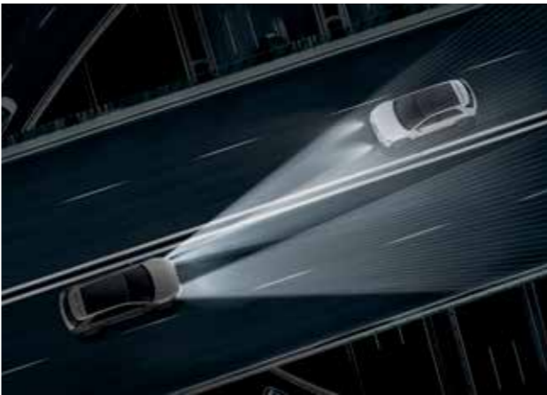
Phares LED Matrix intelligents (IFS Intelligent Front-Lighting System)