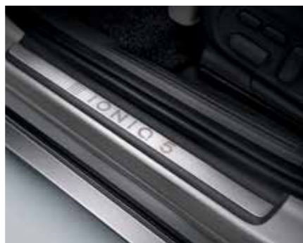
Seuil de porte métalliques