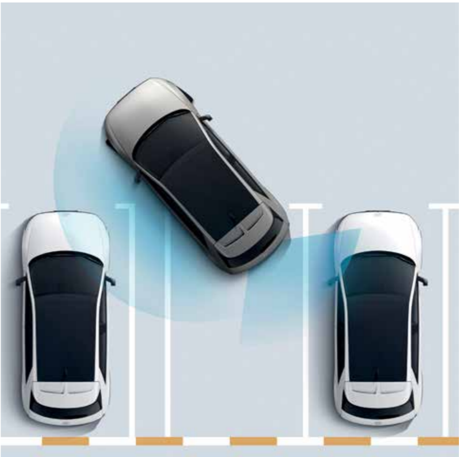
Forward/Side/Reverse/ Parking Distance Warning (PDW) Forward/Side/Reverse Parking Distance Warning (PDW) prévient des collisions avec des objets situés autour du véhicule à faible vitesse.