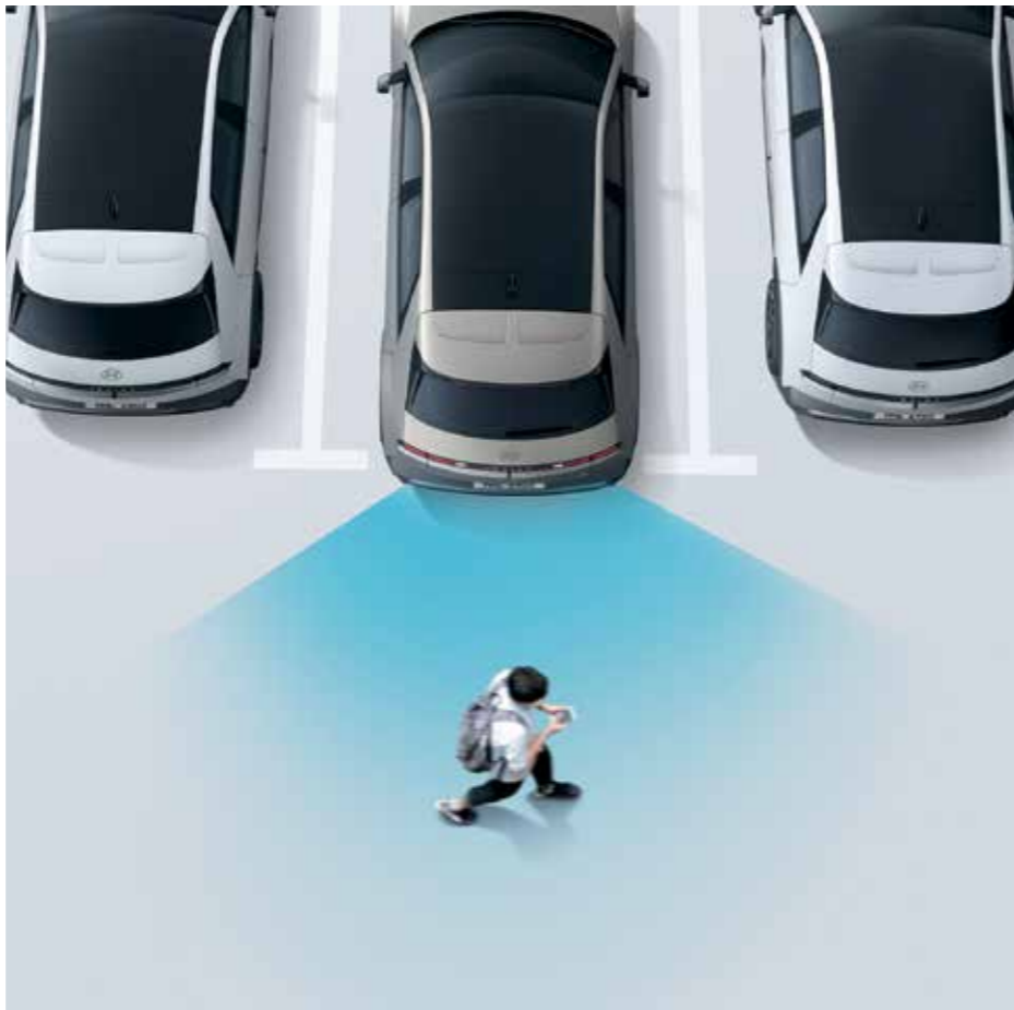
Parking Collision-Avoidance Assist (PCA) Parking Collision-Avoidance Assist (PCA) pour stationnement avant/arrière/latéral avertit et assiste en cas de freinage d'urgence s'il y a un risque de collision avec un objet à l'arrière lors de la marche arrière.