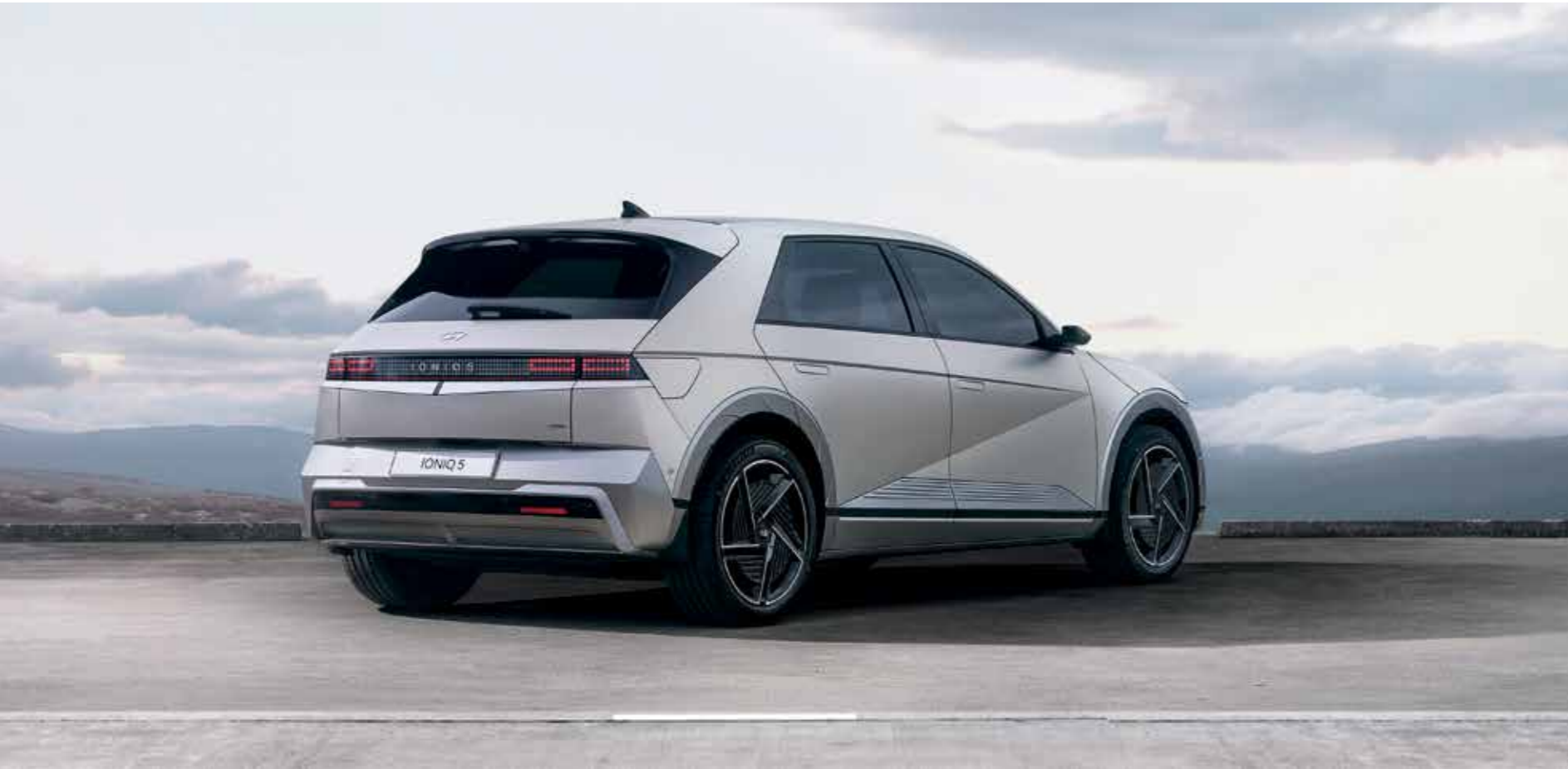
Design de pare-chocs et plaques de protection larges à l'arrière / feux arrière à LED

Le design innovant de l'éclairage LED avec les pixels paramétriques distinctifs est visible à l'arrière, tandis que l'aile arrière renforce l'élégance du design.