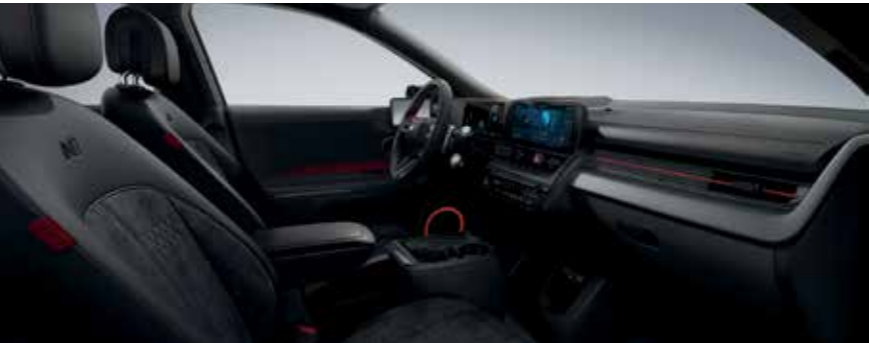
Noir N Line avec surpiqûres rouges