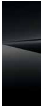
Abyss Black (A2B)