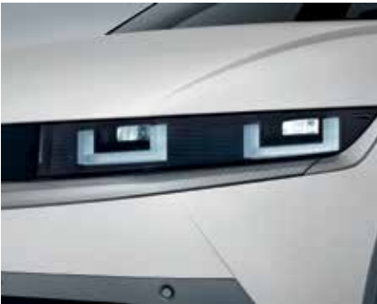
Phares à LED (type projection)