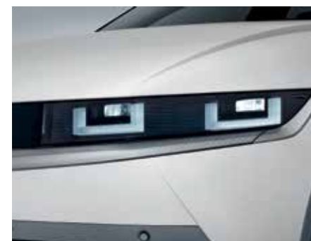
Phares à LED (type projection)