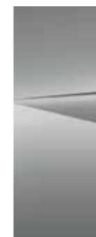
Cyber Gray (C5G)