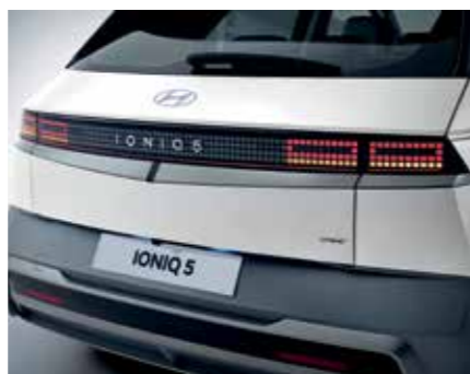
Feux arrière à LED