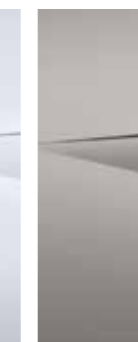
Gravity Gold (W3T)