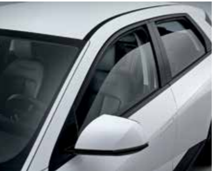
Vitres acoustiques des 1ère et 2ème rangées