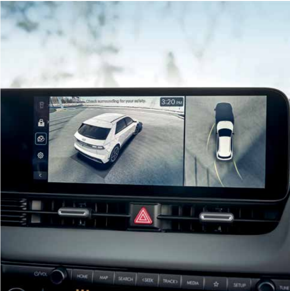
SVM (Surround View Monitor), caméra 360°