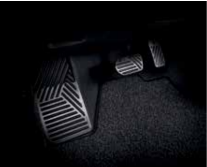
Pédales et repose-pied en métal