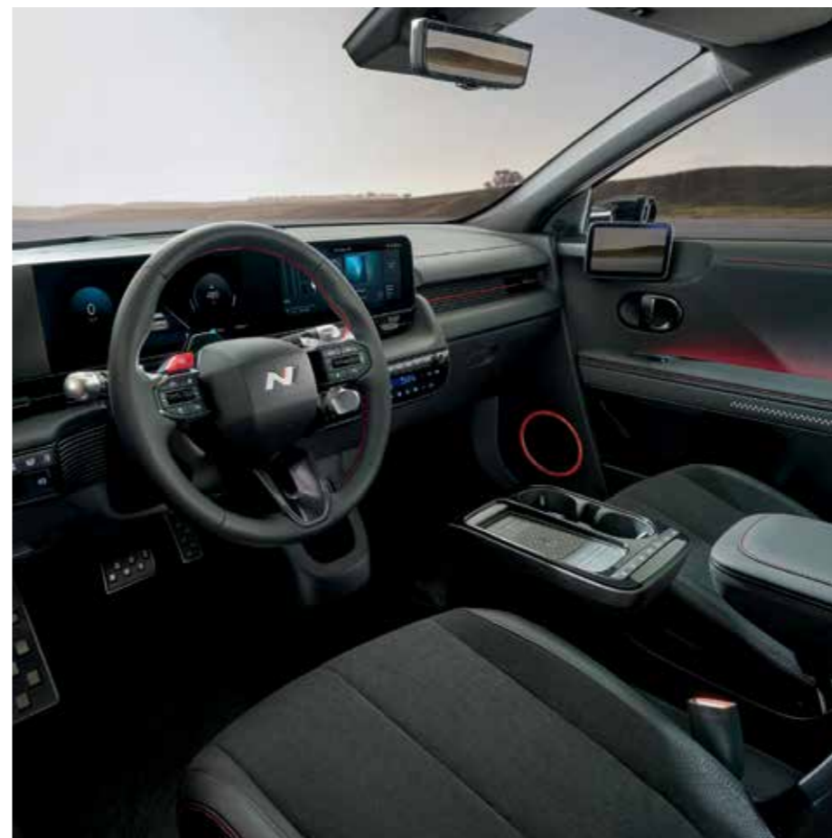
Guidon exclusif N Line / Pédales en métal