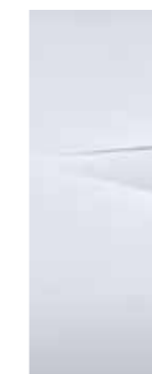
Atlas white