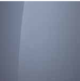
Meta Blue (PM2)