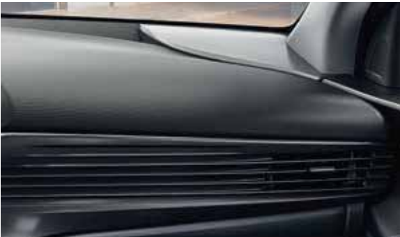
Trim Black Mono