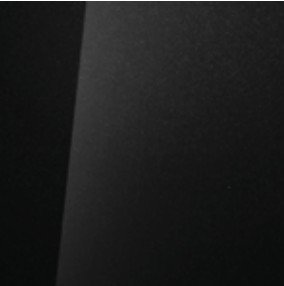
Phantom Black (X5B)