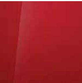
Dragon Red (SRF)