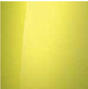
Lucid Lime (N6M)