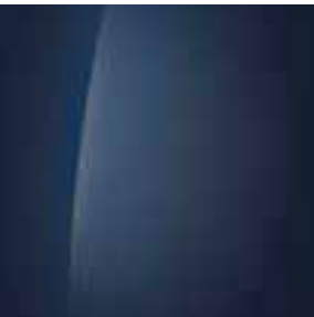
Vibrant Blue (UC3)