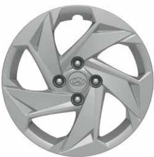
Jantes en acier 15"