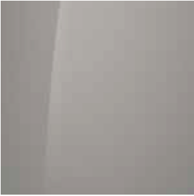
Lumen Grey (Y3H)