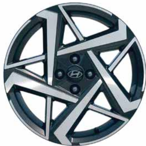
Jantes en alliage léger 17"