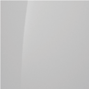
Atlas White (SAW)