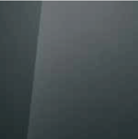
Aurora Grey (A7G)