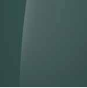
Mangrove Green (MG2)