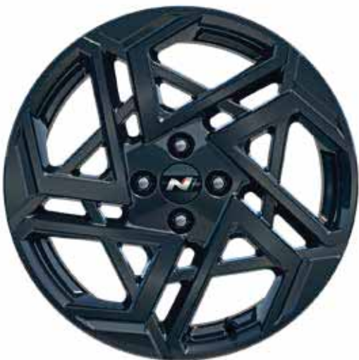
Jantes en alliage léger 17" (N-line)