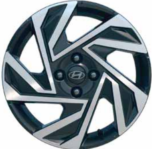
Jantes en alliage léger 16"