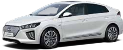
Polar White Solid