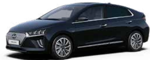
Phantom Black Mica + € 900