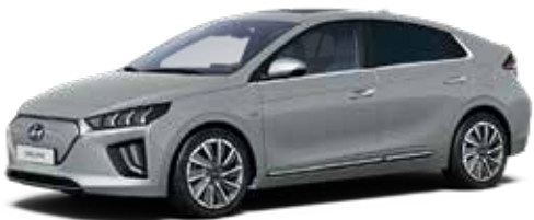
Typhoon Silver Metallic + € 800