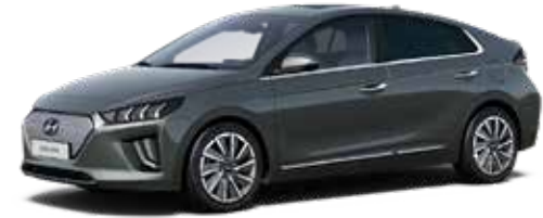
Amazon Grey Metallic + € 800