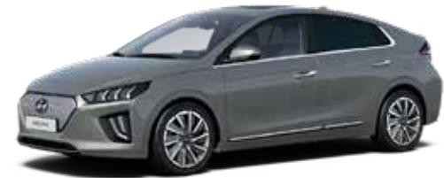
Fluidic Metal Metallic + € 800