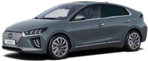
Electric Shadow Solid