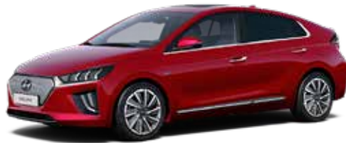
Fiery Red Metallic + € 800