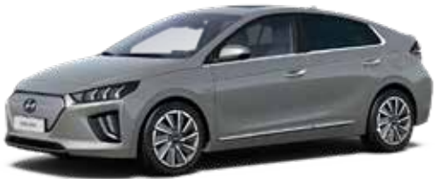
Cyber Grey Metallic + € 800