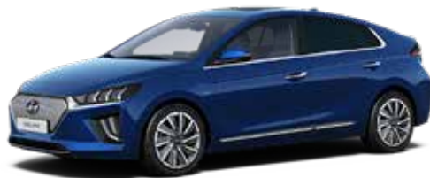
Intense Blue Mica + € 900