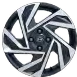
16-inch lichtmetalen velg