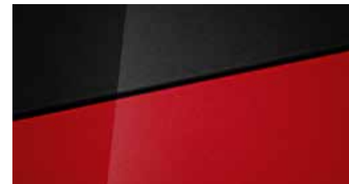
Dragon Red Mica + € 795 Dragon Red Mica Two-tone Phantom Black + € 995