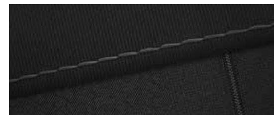
Stof, zwart en grijs (i-Motion)