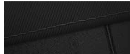
Stof, zwart, mono