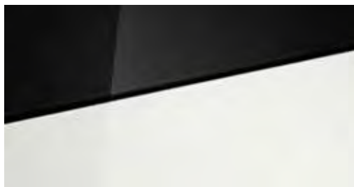
Atlas White Solid Atlas White Solid Two-tone Phantom Black + € 295