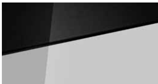
Lumen Gray Mica + € 795 Lumen Gray Mica Two-tone Phantom Black + € 995