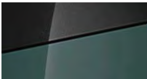
Mangrove Green Mica + € 795 Mangrove Green Mica Two-tone Phantom Black + € 995