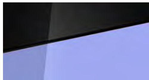
Meta Blue Mica + € 795 Meta Blue Mica Two-tone Phantom Black + € 995