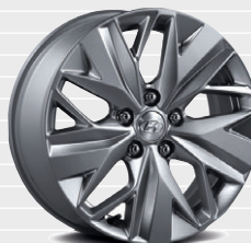
Cerchi in lega leggera 17" 225/60 R17