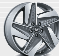
Cerchi in lega leggera 19" 245/45 R19