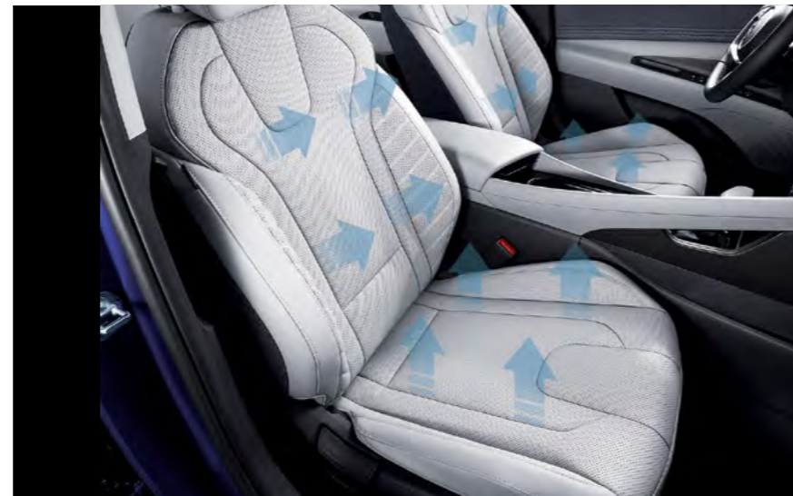
Wentylowane fotele przednie