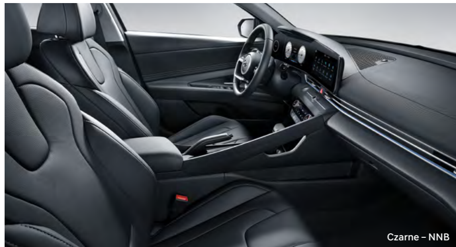
Czarne – NNB