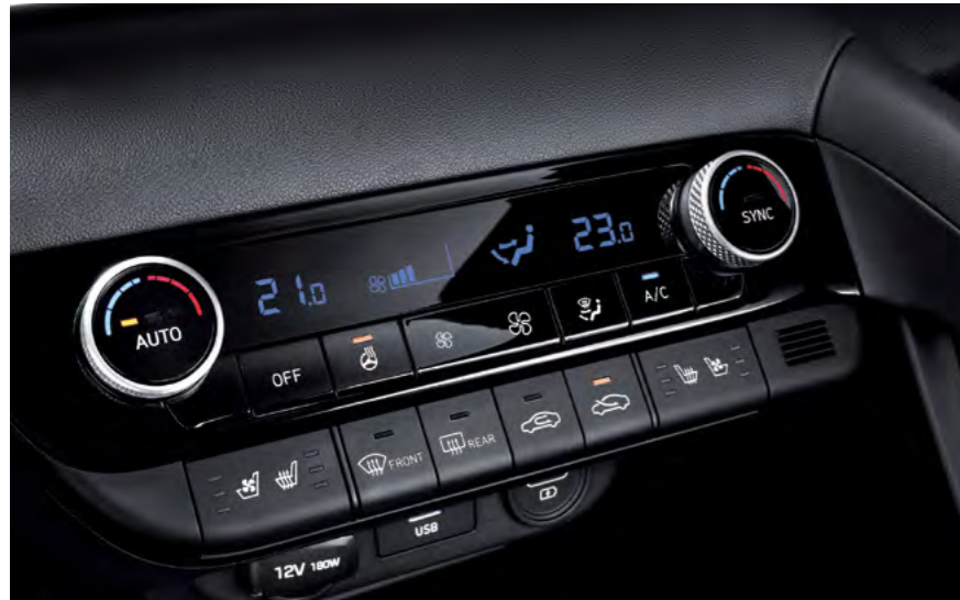
Automatyczna klimatyzacja dwustrefowa