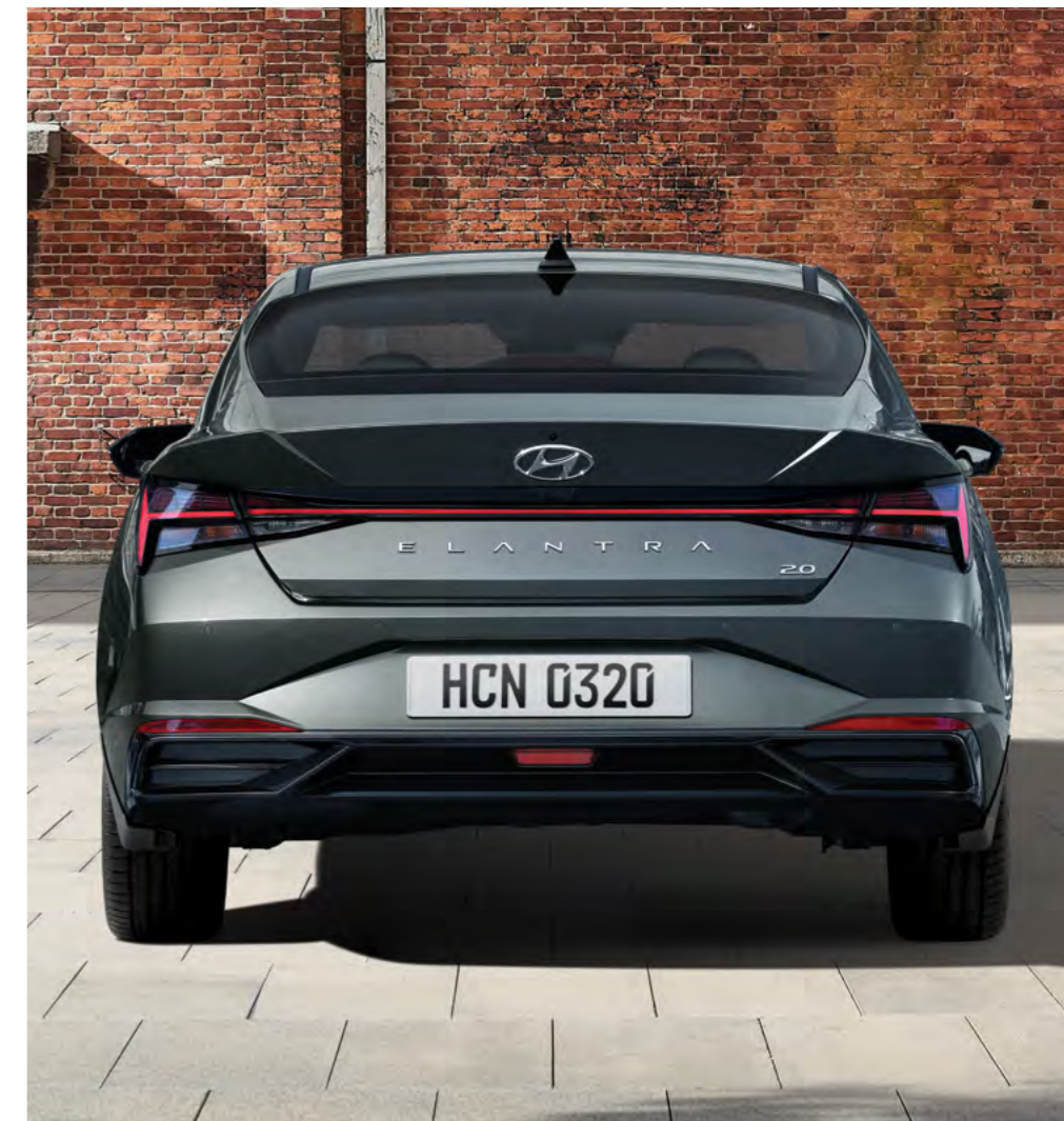
Tylne światła zespolone.