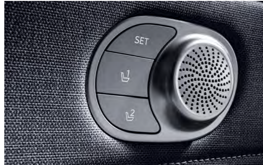
Fotel kierowcy z pamięcią ustawień