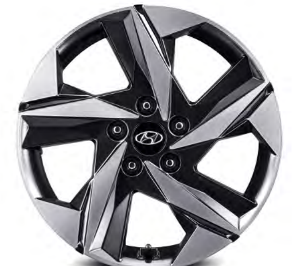
Felgi aluminiowe 17"