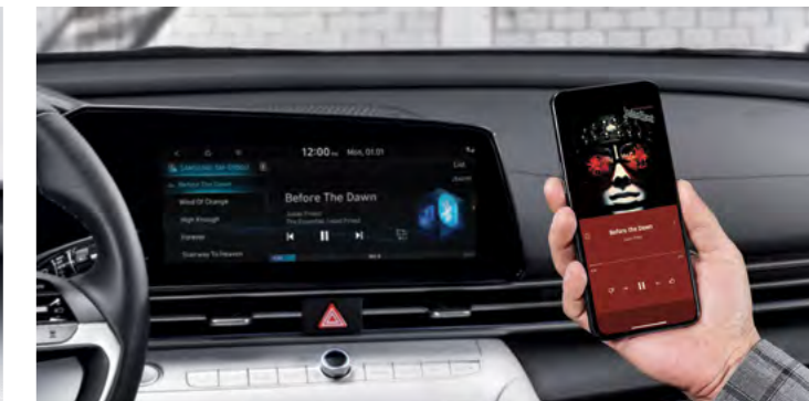
Parowanie kilku urządzeń Bluetooth.