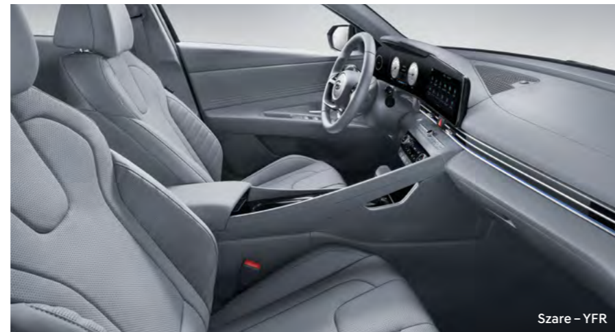
Szare – YFR