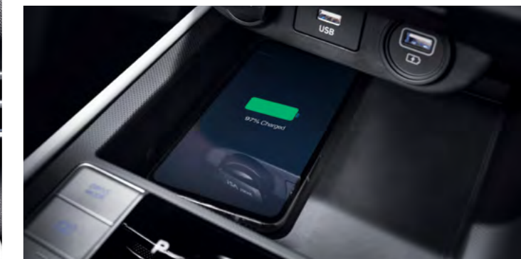
Bezprzewodowe ładowanie smartfona.