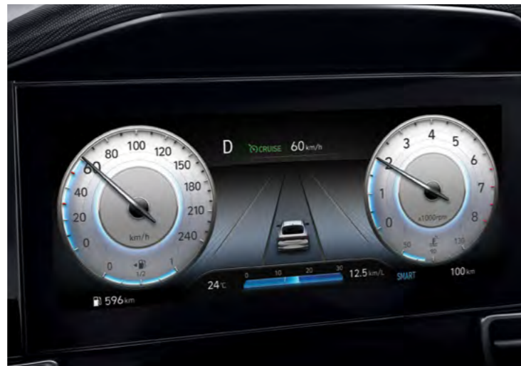
Cyfrowy zestaw wskaźników 10,25"