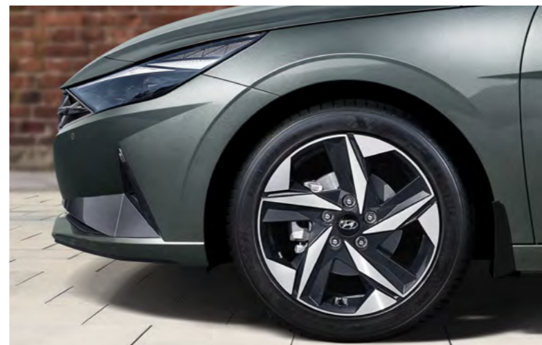
Felgi aluminiowe 17" i opony.