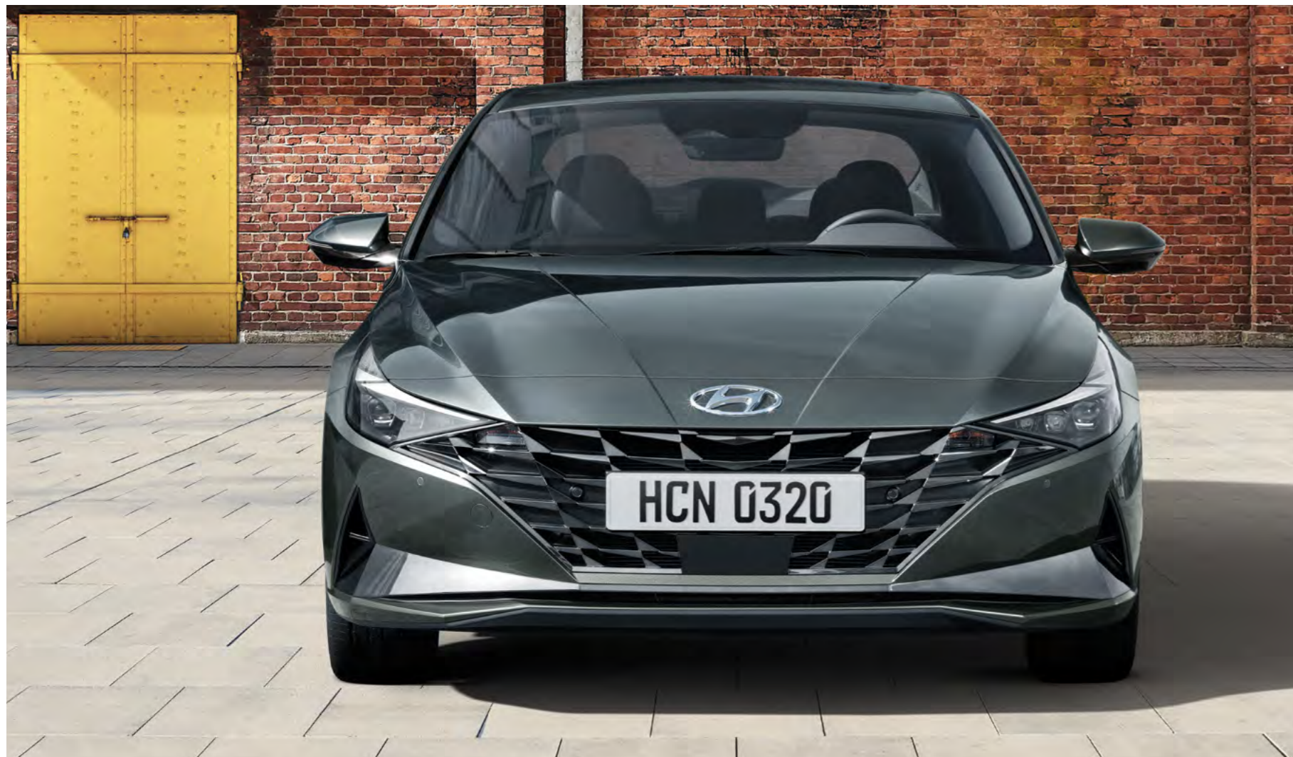
Grill przedni parametrycznym wzorem klejnotu.

Stereoskopowy wzór parametrycznego klejnotu podkreśla głębię grilla przedniego, przywodząc na myśl szlifowane diamenty, a śmiałe, wydłużone przednie reflektory łączą się, nadając ELANTRZE sportowy wygląd. Krawędziowy spoiler na bagażniku łączy zintegrowane tylne światła typu all-in-one – powstała w ten sposób świetlna litera H reprezentująca Hyundaię pomaga stworzyć zaawansowany technologicznie, futurystyczny wygląd tyłu.