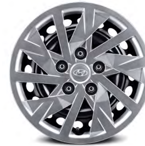
Felgi stalowe 15" i kołpaki