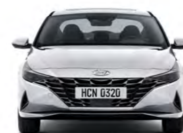
Rozstaw kół 1593 (1579) Szerokość całkowita 1825

Jednostka: mm, rozstaw kół podano dla felg 15", zaś wartość w nawiasach dotyczy pojazdu z felgami 17".