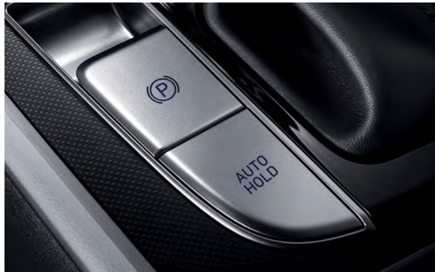
Elektryczny hamulec postojowy