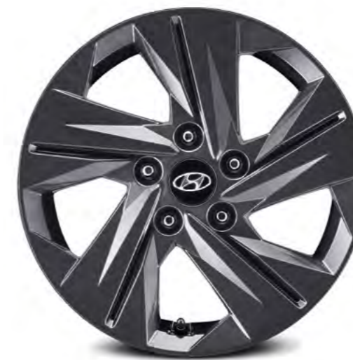
Felgi aluminiowe 16"