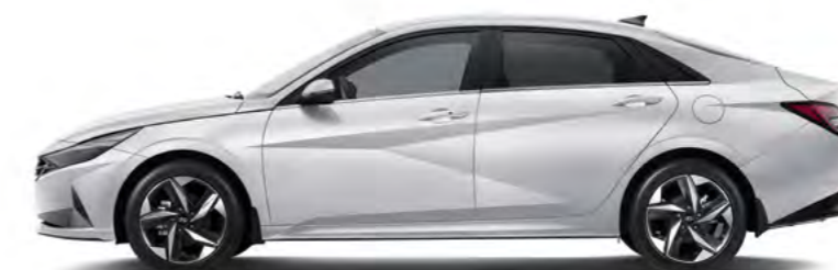
Rozstaw osi 2720 Długość całkowita 4650