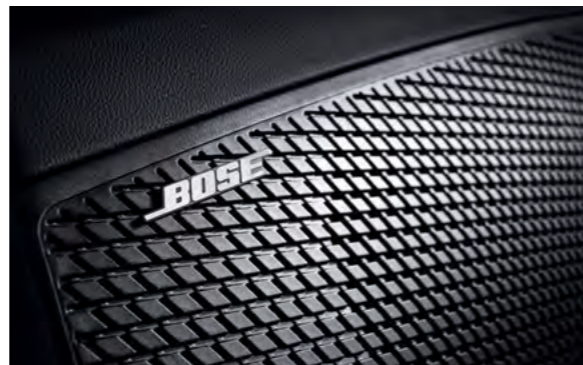
System Premium Audio firmy BOSE.