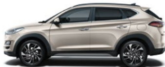
WHITE SAND * (Y3Y - METALICZNY)