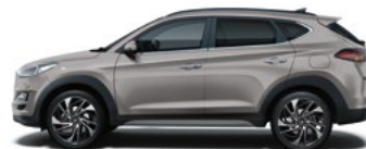
SILKY BRONZE (B6S - METALICZNY)