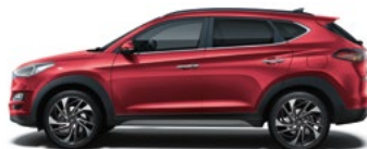
SUNSET RED (WR6 - PERŁOWY)