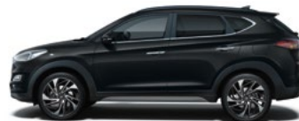
PHANTOM BLACK (PAE - PERŁOWY)