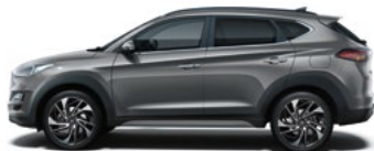
MICRON GREY * (Z3G - METALICZNY)