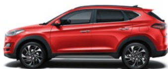
ENGINE RED (JHR - BEZ DOPLĄTY)