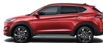
FIERY RED * (PR2 - METALICZNY)