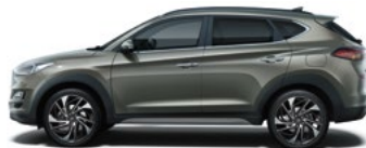
OLIVINE GREY (X5R - METALICZNY)