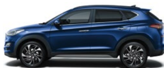
STELLAR BLUE (RWB - METALICZNY)