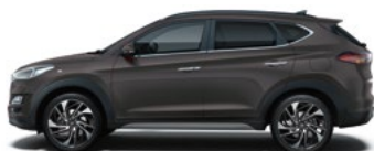
DARK KNIGHT (YG7 - PERŁOWY)

* Sprawdź dostępność u dealera ** Tylko dla wersji N Line