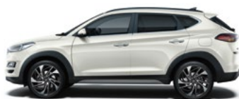
POLAR WHITE (PYW - BEZ DOPLĄTY)