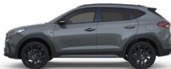
SHADOW GREY * (TKG - SPECJALNY)