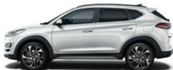
PLATINUM SILVER (U3S - METALICZNY)