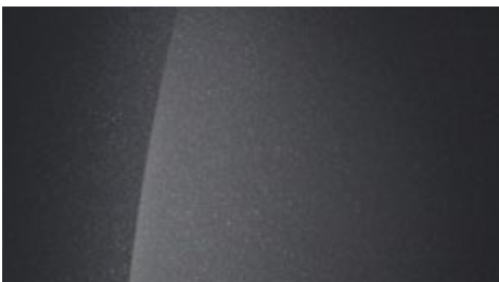
Ecotronic Gray Pearl (PE2 – perłowy)