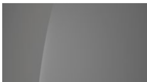
Cyber Gray Metallic (C5G – metaliczny)