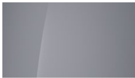
Sonic Blue (PYU – specjalny)