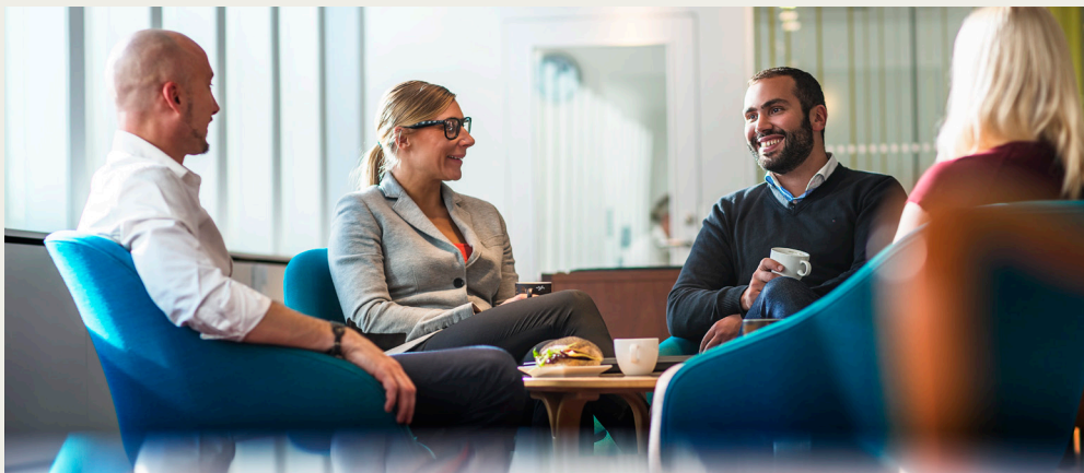
Alla medarbetare inom Folksams bolag ska följa de etiska regler för hur arbetet ska utföras.

De etiska reglerna visar också hur du som medarbetare ska förhålla dig i olika situationer. De ger dessutom en vägledning för dig som kommer i kontakt med oss i rollen som till exempel leverantör, partner eller opinionsbildare.