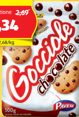
PAVESI GOCCIOLE 500 g