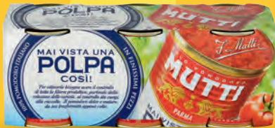
MUTTI POLPA DI POMODORO 3 x 300 g