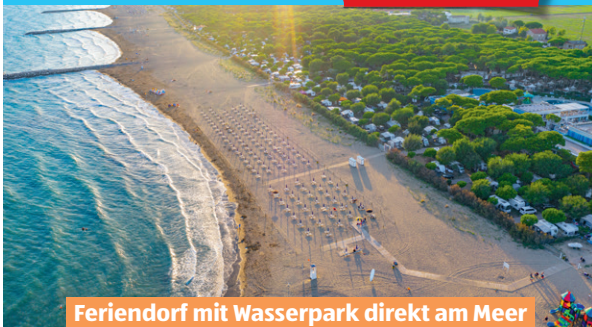
Feriendorf mit Wasserpark direkt am Meer