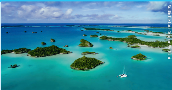
Südtiroler Alpen / Fidschi