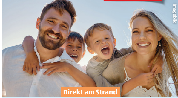
Direkt am Strand