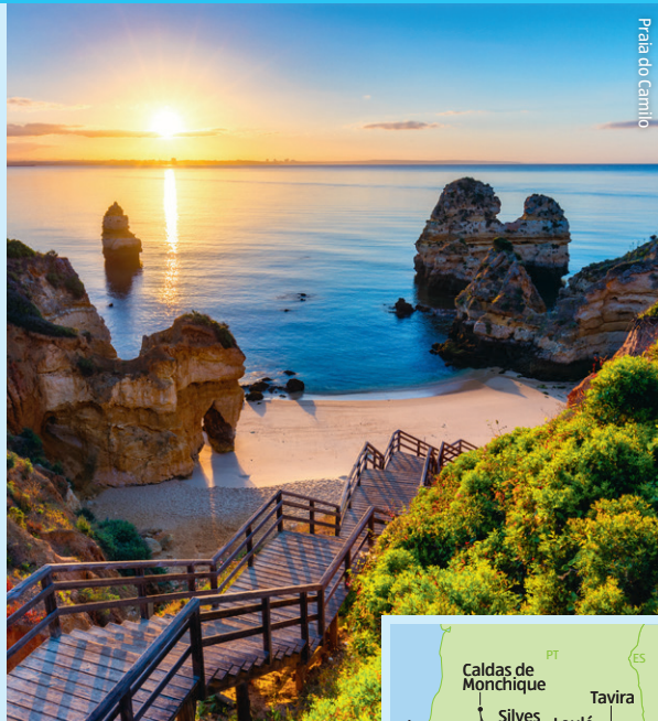
Prata do Camião