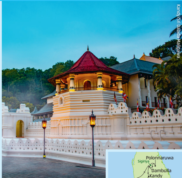
Kandy/Sri Baladeya Mahiprswa

Inkl. Ausflug zur Felsenfestung Sigiriya