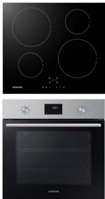
MODELL: NV68A1140BS/EF& NZ64F3NM1AB/UR

Bevor Sie Ihr Gerät einsenden wenden Sie sich telefonisch oder per Mail an unseren KUNDENDIENST . So können wir Ihnen bei eventuellen Bedienungsfehlern helfen.