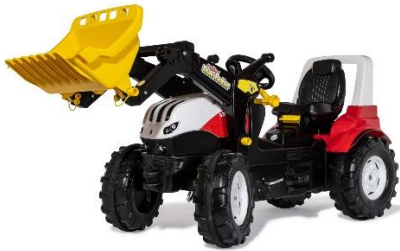
MODELL: Steyr Premium

Bevor Sie Ihr Gerät einsenden wenden Sie sich telefonisch oder per Mail an unseren KUNDENDIENST . So können wir Ihnen bei eventuellen Bedienungsfehlern helfen.