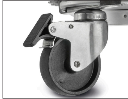
TRANSPORT-ROLLEN-SET 4 Lenkrollen mit Feststeller Art.-Nr. 3585