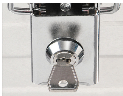
INNSTIKKSLÅSSETT I 2 innstikkslåser med 2 nøkler (med lik nøkkel per sett) Vare nr. 3750