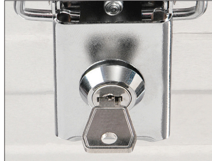
STECKSCHLOSS-SET II 2 Einbauschlösser mit 2 Schlüsseln (immer gleichschließend) Art.-Nr. 3751