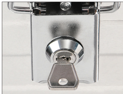
КОМПЛЕКТ БРАВИ I 2 вградени брави с 2 ключа (с еднакви ключове в комплекта) Артикул № 3750