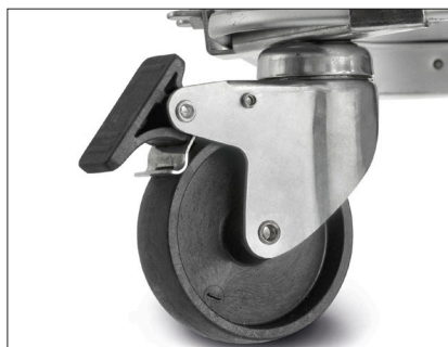
SÆT MED TRANSPORTHJUL 4 drejelige hjul med bremses Vare nr. 3585