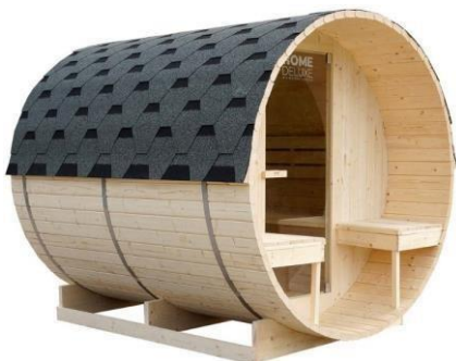
IZDELEK: Savna LAHTI Deluxe L

Za dodatne informacije lahko kontaktirate „ B2B@homedeluxe.de “, kjer bomo poskušali rešitev najti v najkrajšem možnem času.