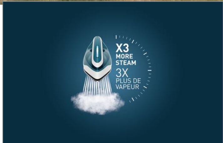
EXPRESS EASY SV6131CH SV6131CH