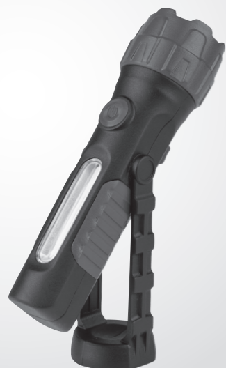
Eredeti használati utasítás