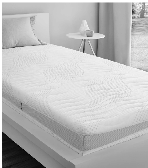
MODELL: Matratze Memo Royal 90x200 cm