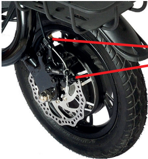
Schrauben der Bremssattelbefestigung