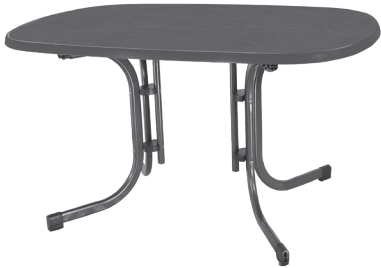
Table de jardin · Tavolo da giardino · Vrtna miza · Kerti asztal